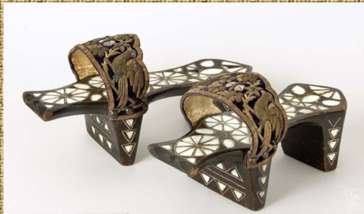
Гэта – обувь-скамеечка