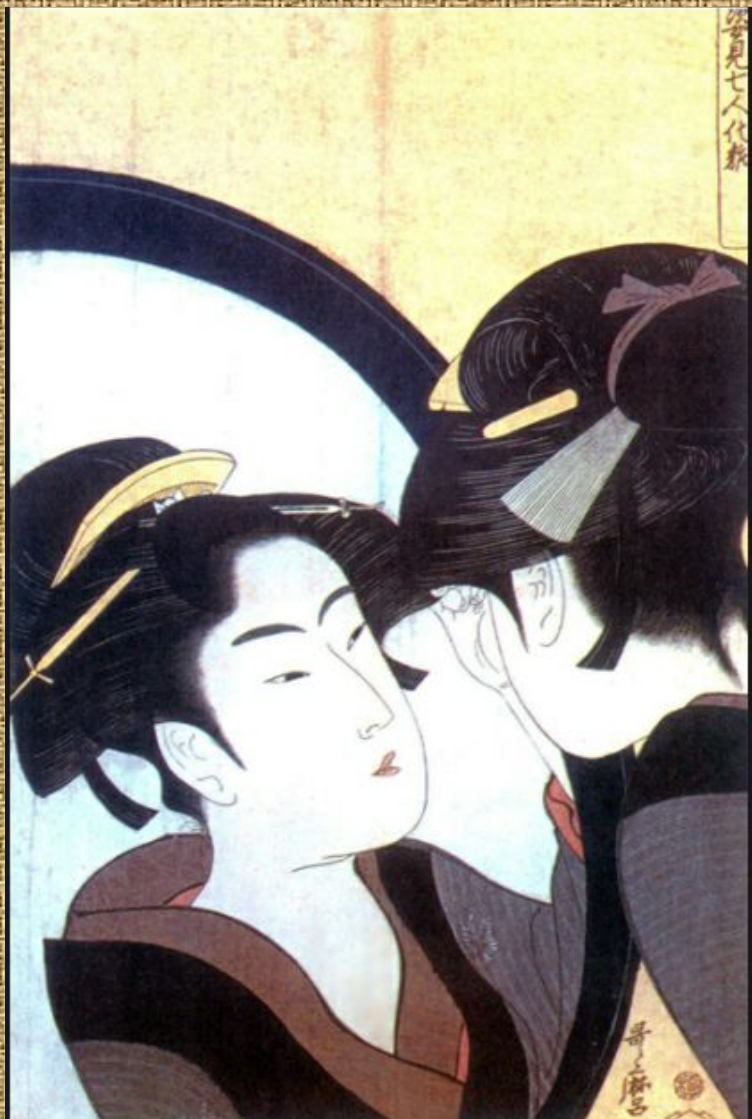
Утамаро Китагава (Красавица перед зеркалом)