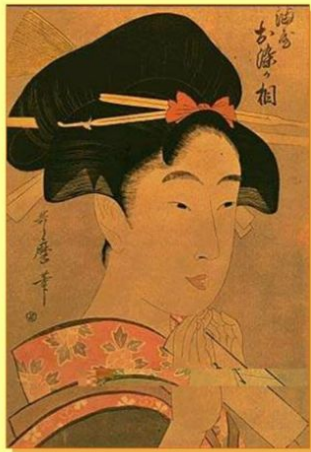
Китагава Утамаро. «Красавица Осомэ». Япония.