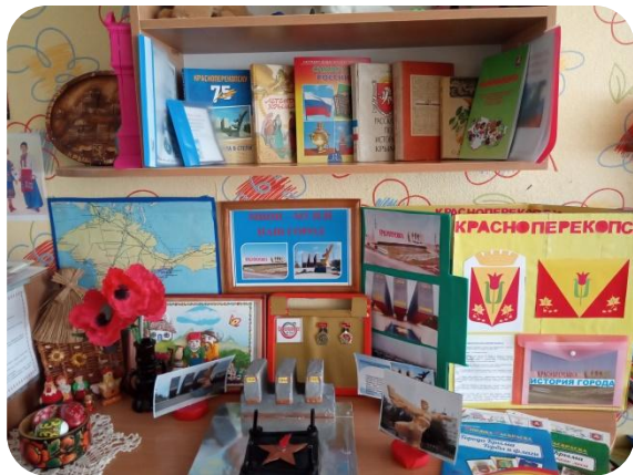
Мини – музей Красноперекопска