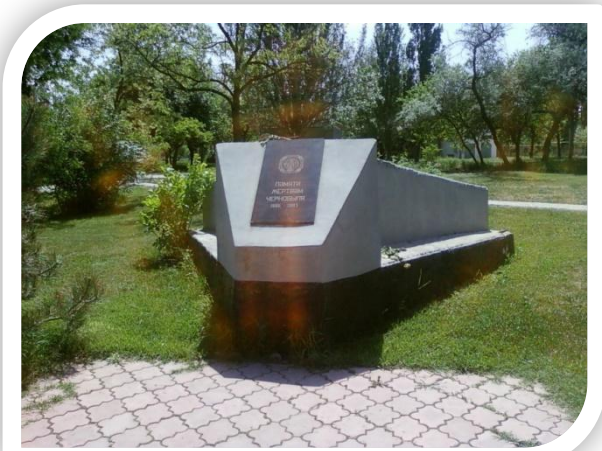
Памяти жертвам Чернобыля