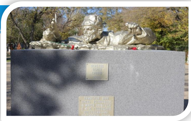
* Переход через Сиваш