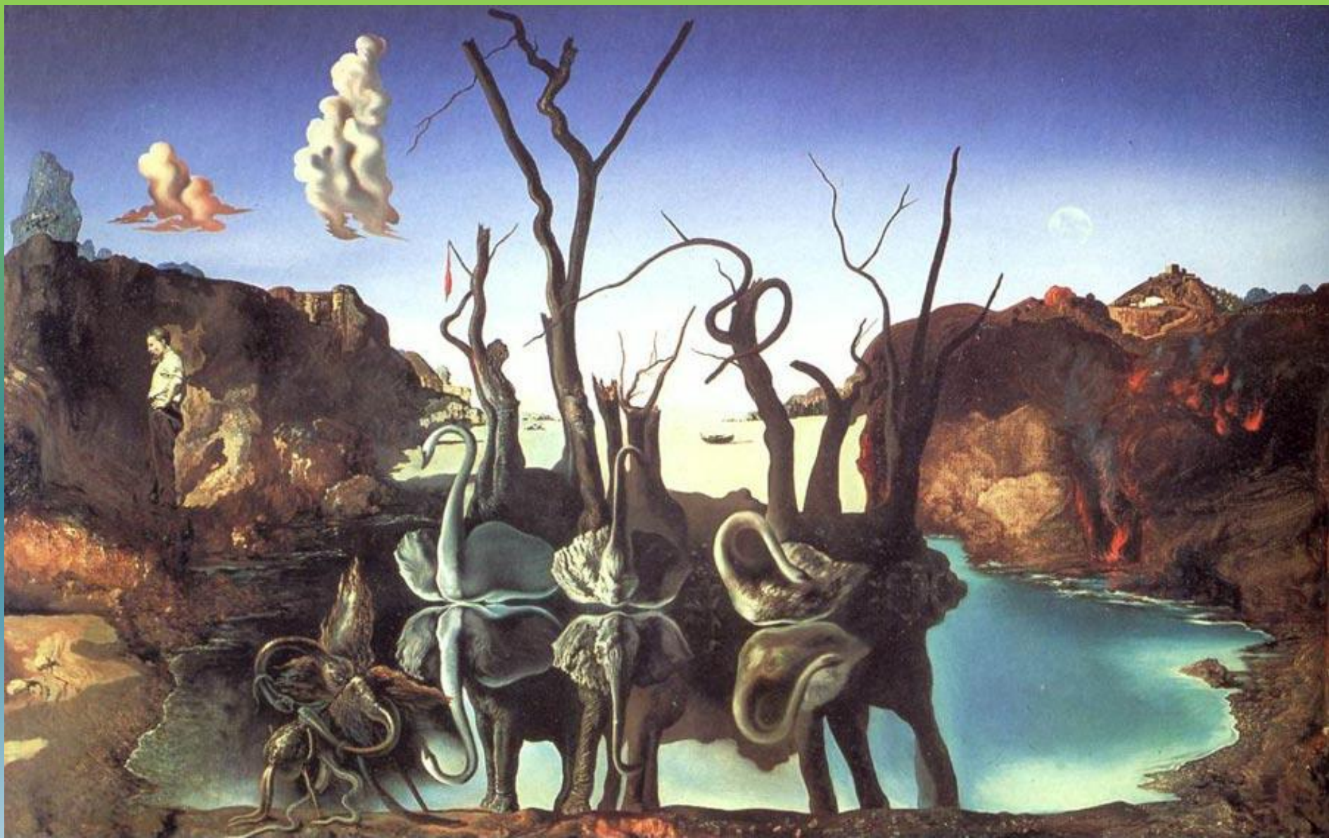
Лебеди, отражающиеся в слонах