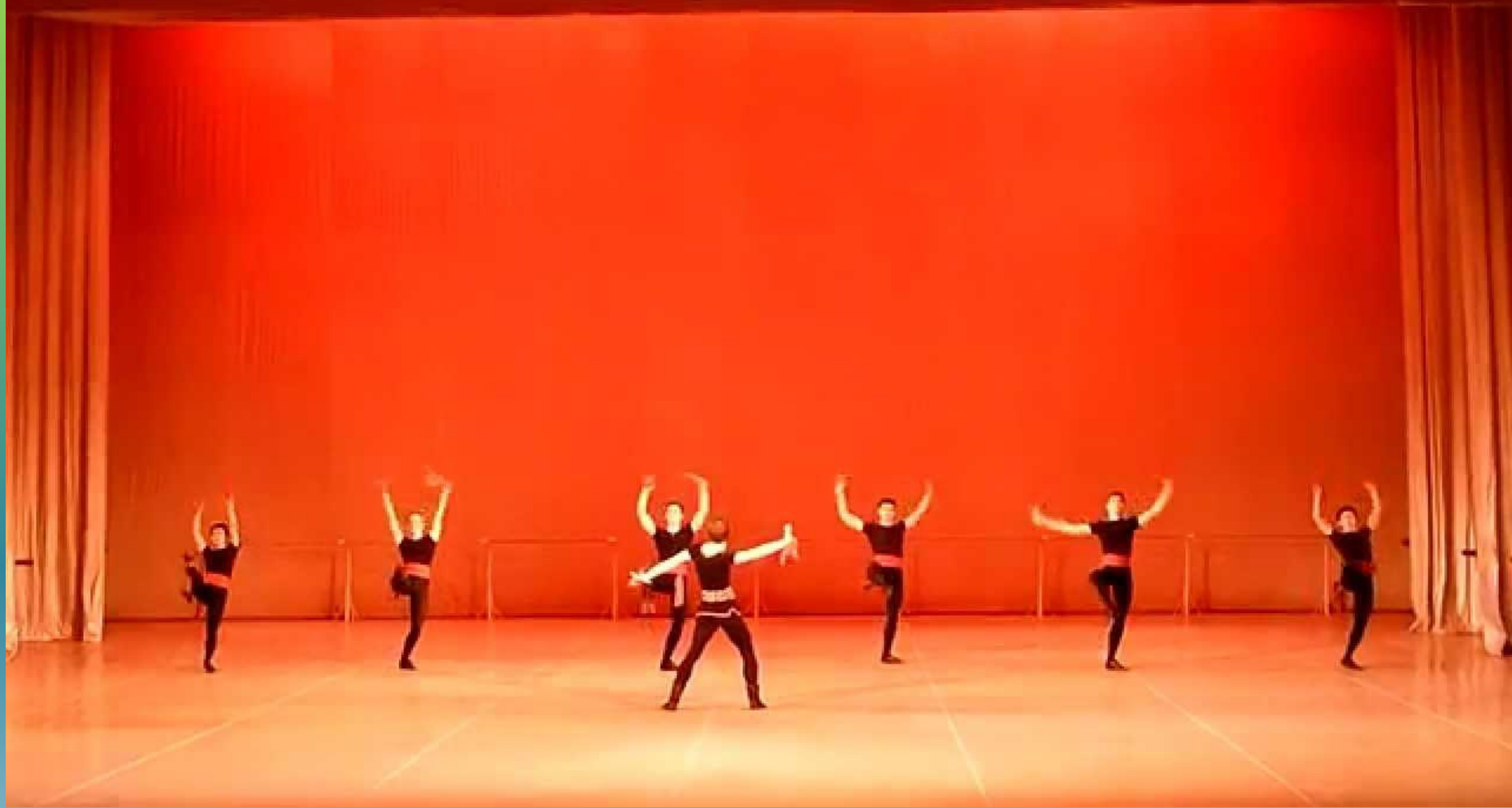
Фрагмент из балета Арама Хачатуряна “Гаяне” “Танец с саблями”