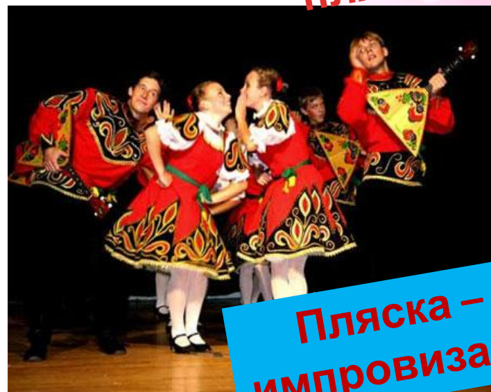
Пляска – импровизаци я