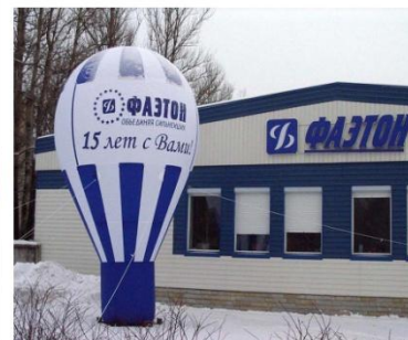
Ледяные и воздушные фигуры