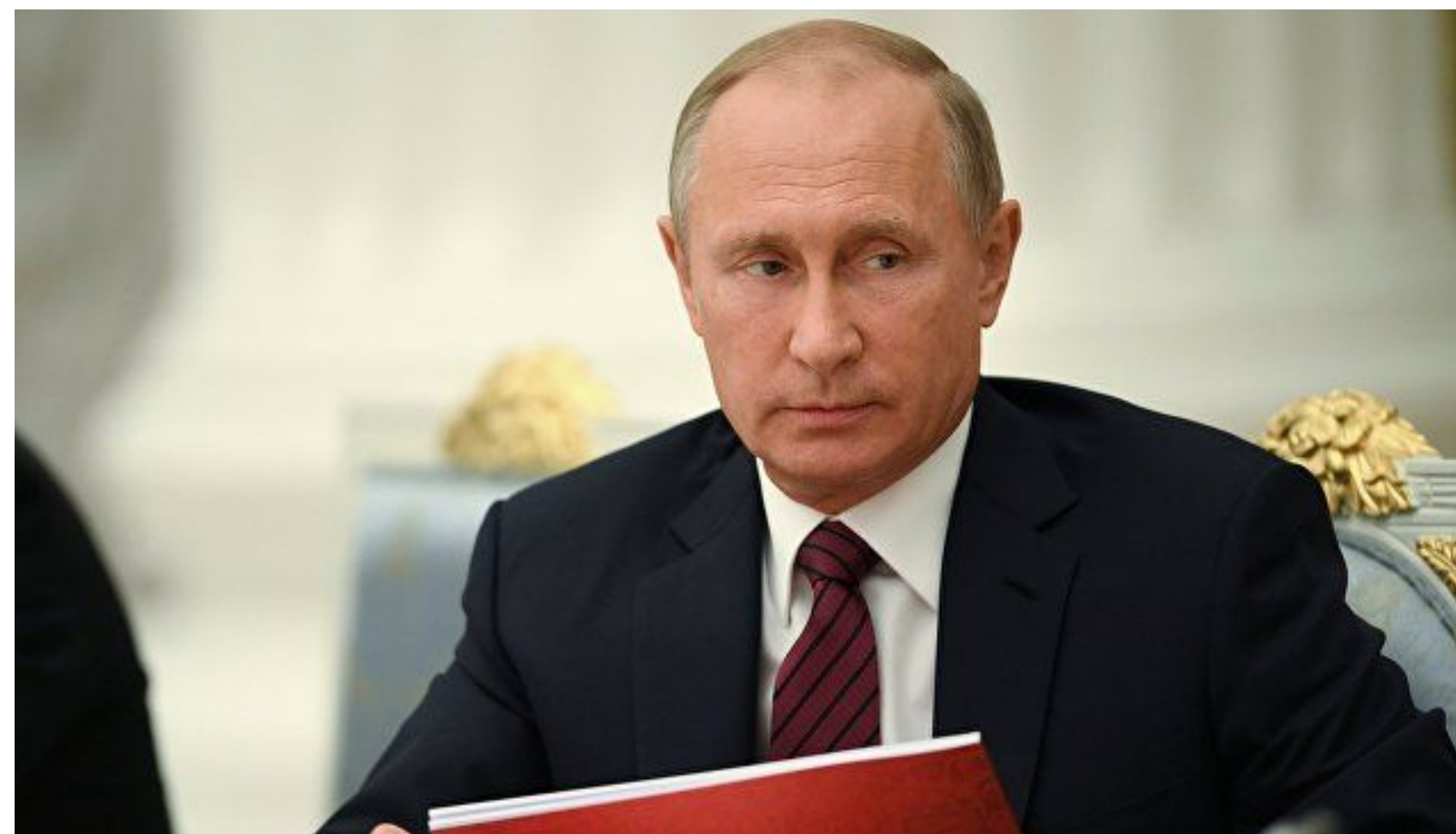
Председатель Совета Безопасности России