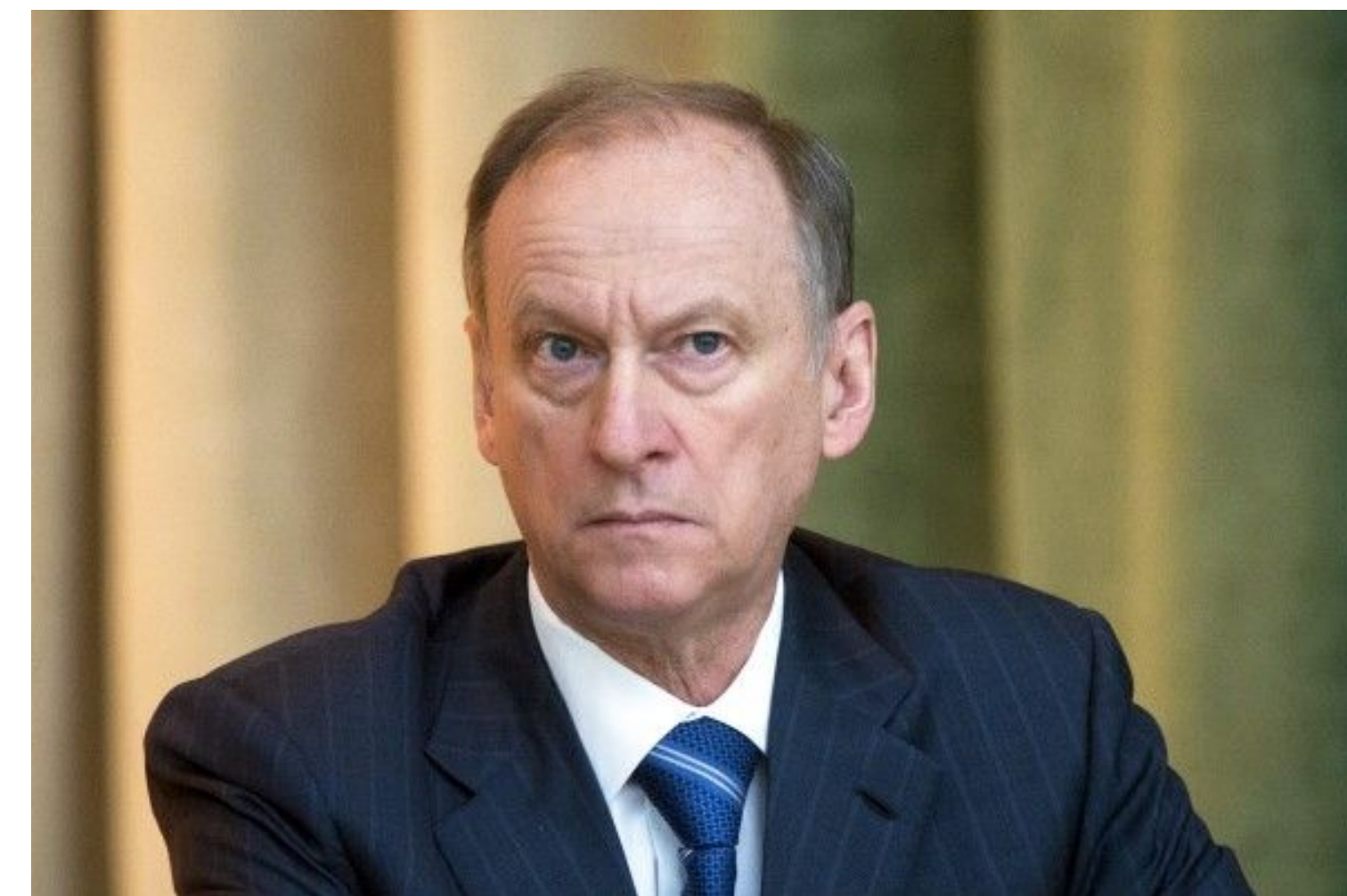
Секретарь Совбеза Патрушев