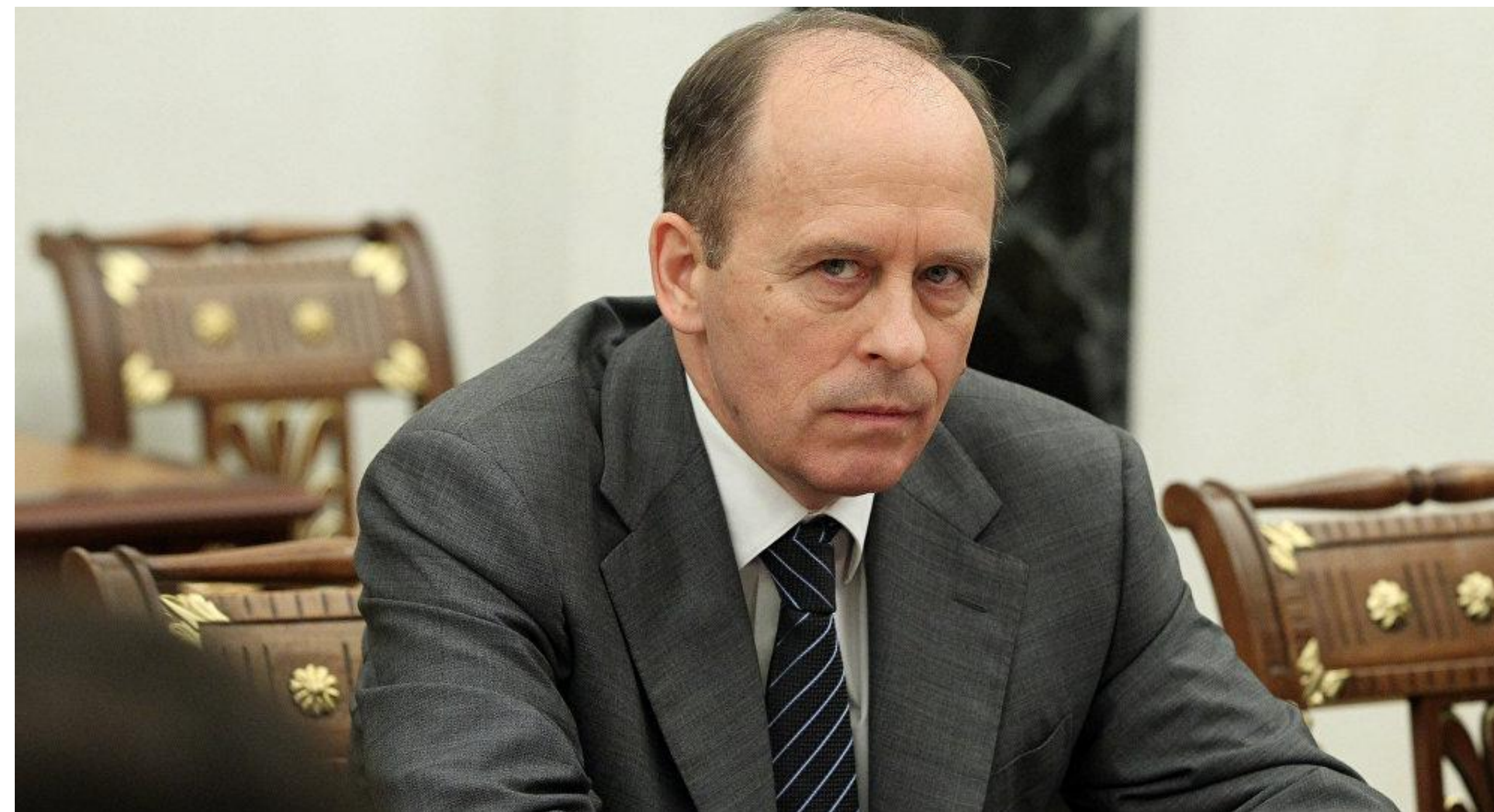
Директор ФСБ Бортников (с 2007 г.)