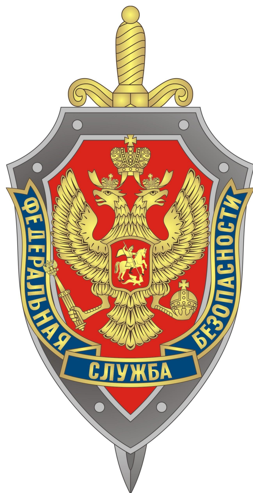
Эмблема ФСБ России