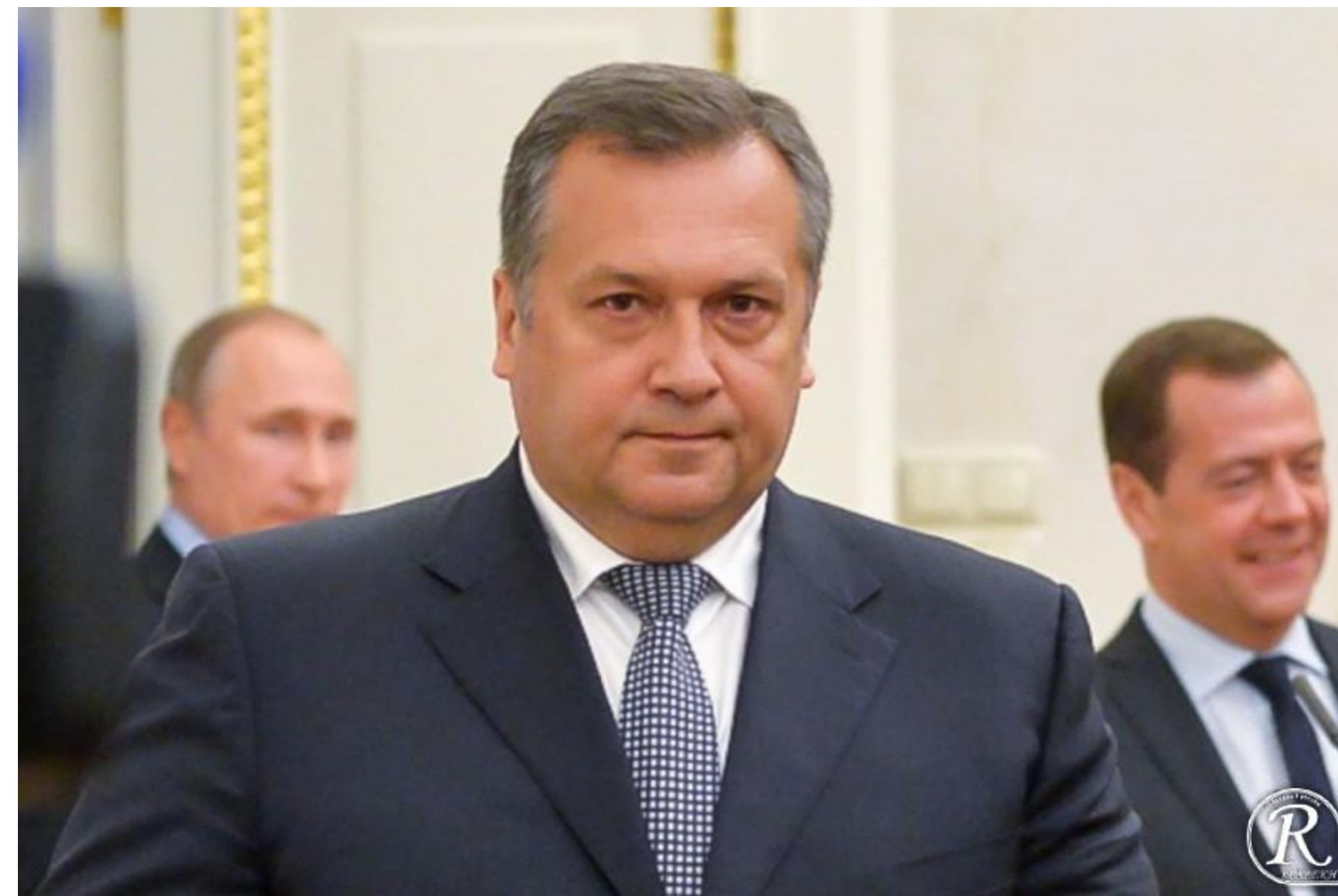
Директор ФСО Кочнёв (с 2016 г.)