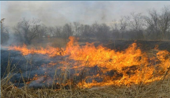
ВОЗГОРАНИЕ СУХОЙ РАСТИТЕЛЬНОСТИ

Прогнозируемые риски. Чрезвычайная пожароопасность (5 класс)