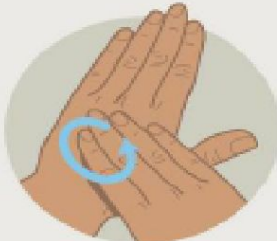
Тыльные стороны кистей