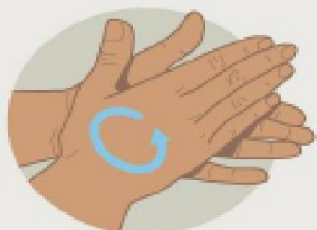
Ладонь к ладони