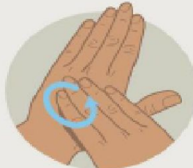
Тыльные стороны кистей