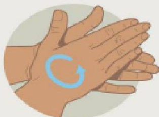
Ладонь к ладони