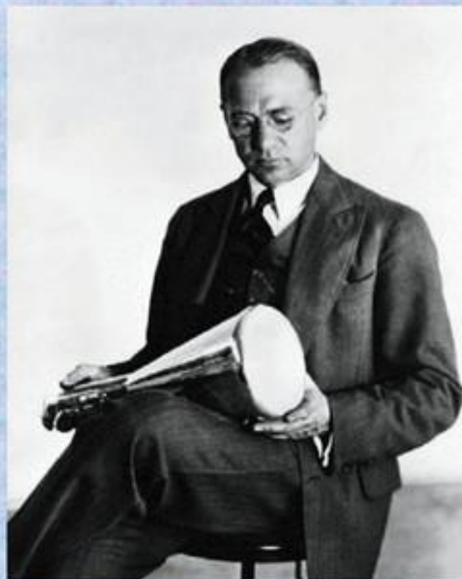
Борис Львович Розінг