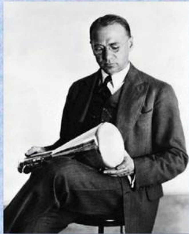
Борис Львович Розінг