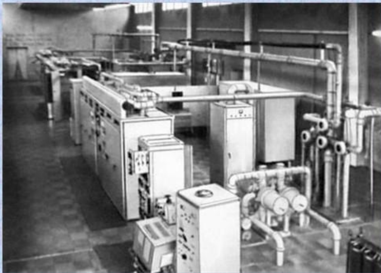
Перша пересувна телевізійна станція