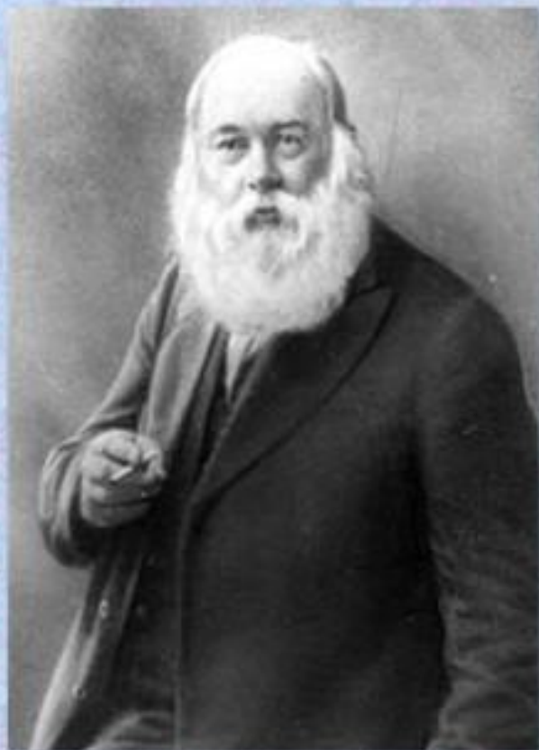
Порфирій Іванович Бахметьєв