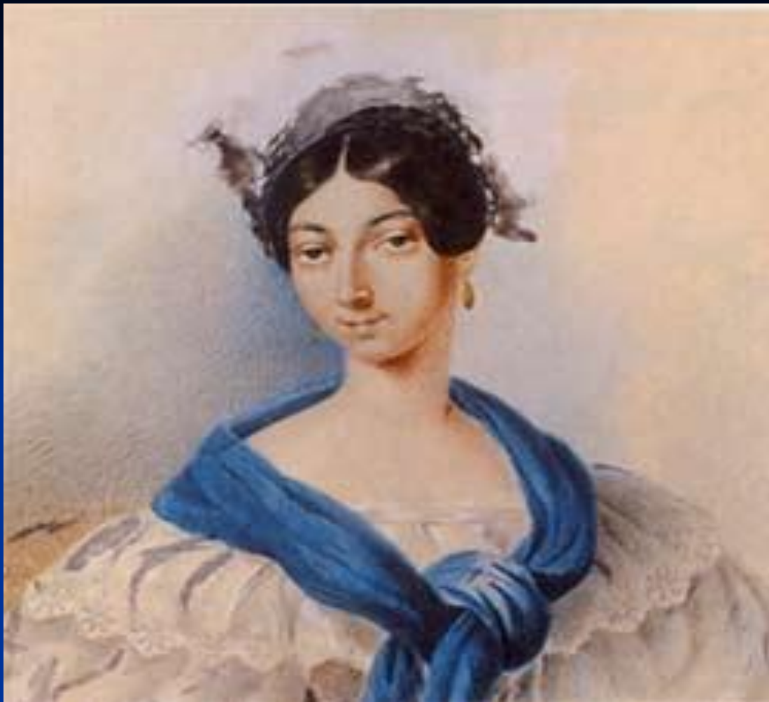
Павлишцева Ольга Сергеевна, рожд. Пушкина (1797-1868) — сестра поэта.