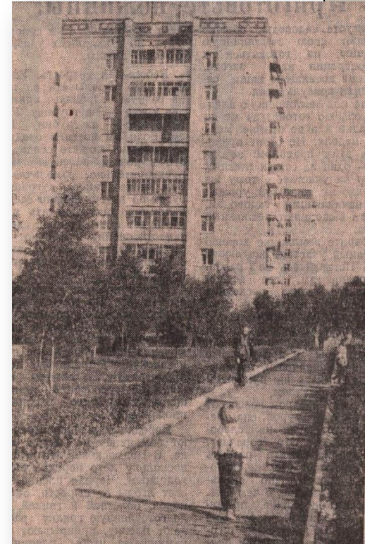
«Каширские известия» от 03.08.1995 № 93 (11770)