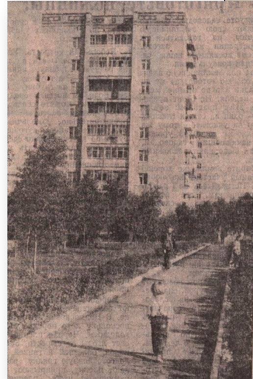
«Каширские известия» от 03.08.1995 № 93 (11770)