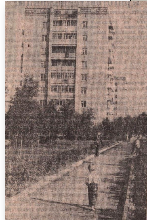
«Каширские известия» от 03.08.1995 № 93 (11770)