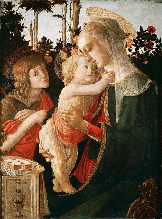
Мадонна с младенцем и Иоаном Крестителем