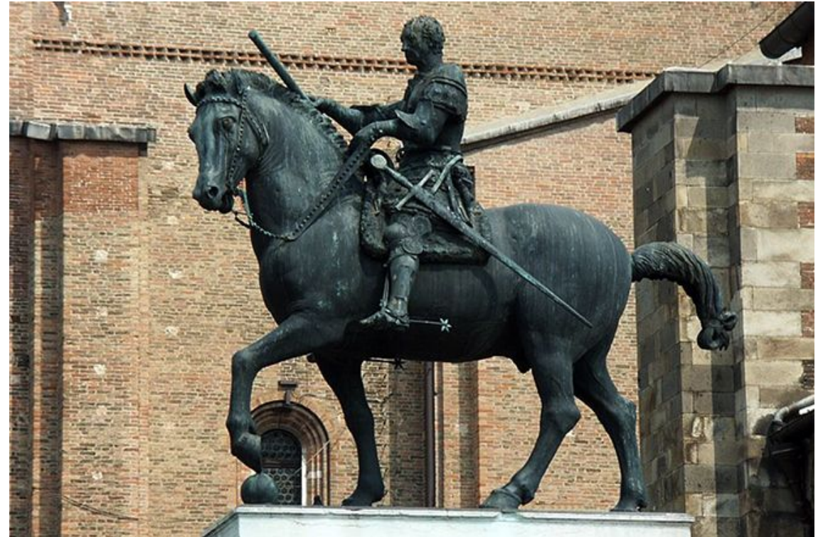
Статуя «Эразмо де Нарни»