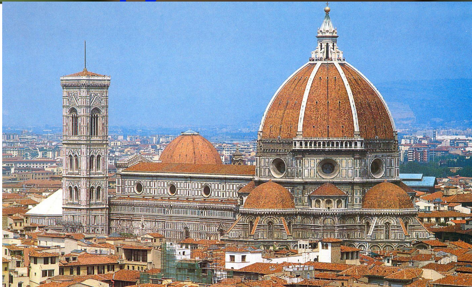
Купол «Санта Мария дель Фьоре» Флоренция