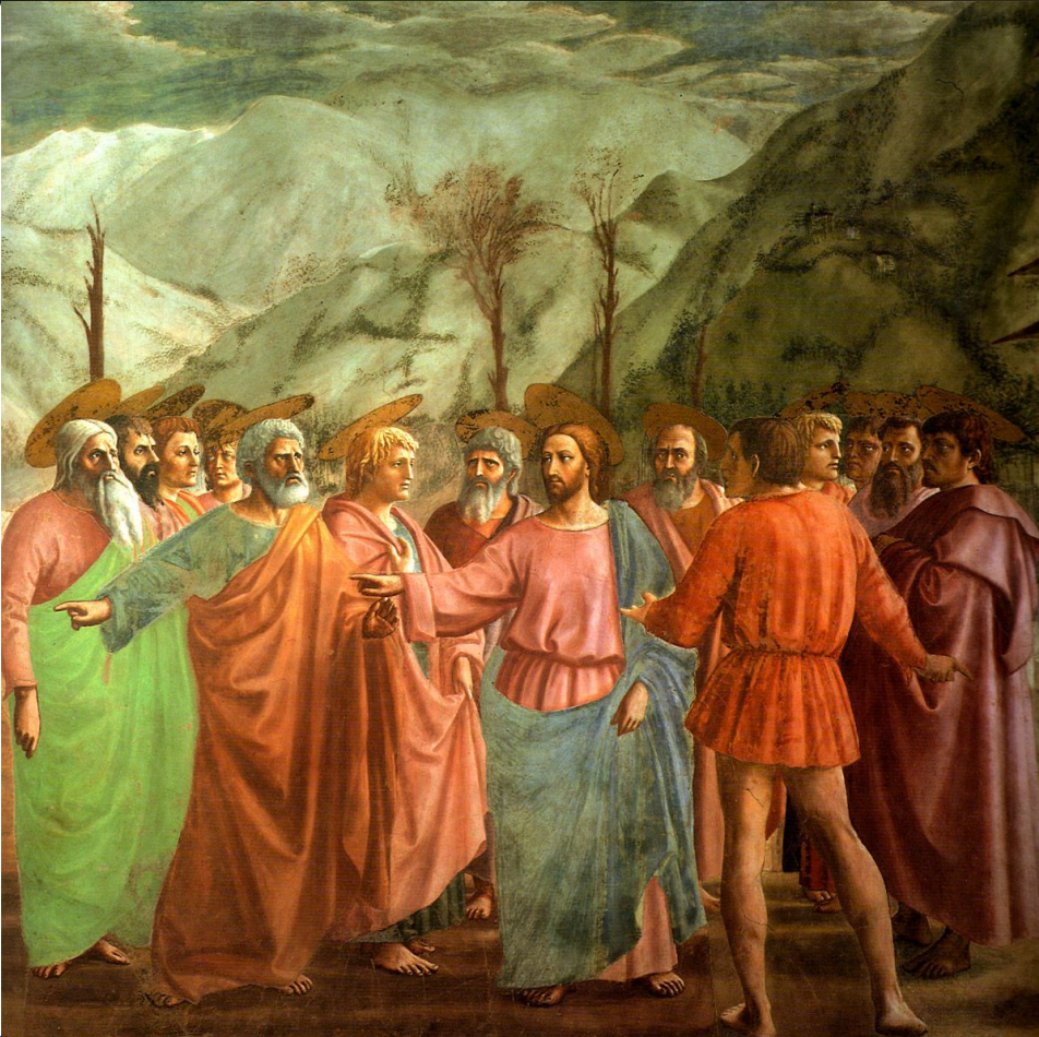
Чудо со статиром