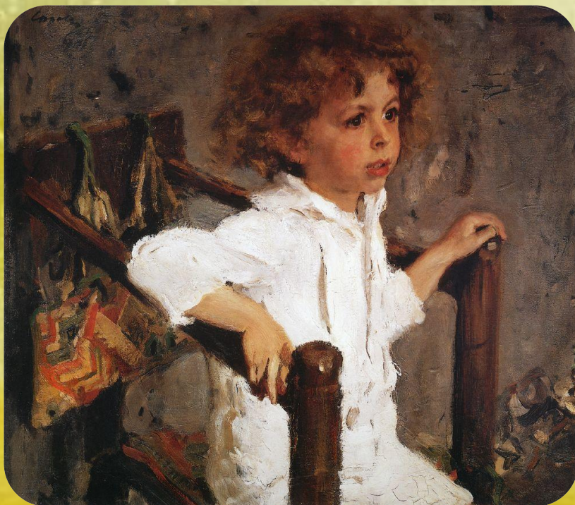
В. Серов «Мика Морозов»