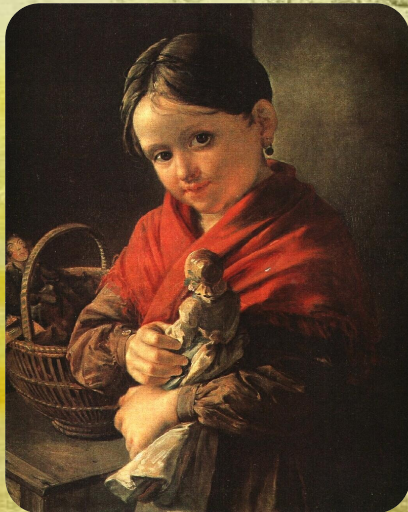
В. Тропинин «Девочка с куклой»