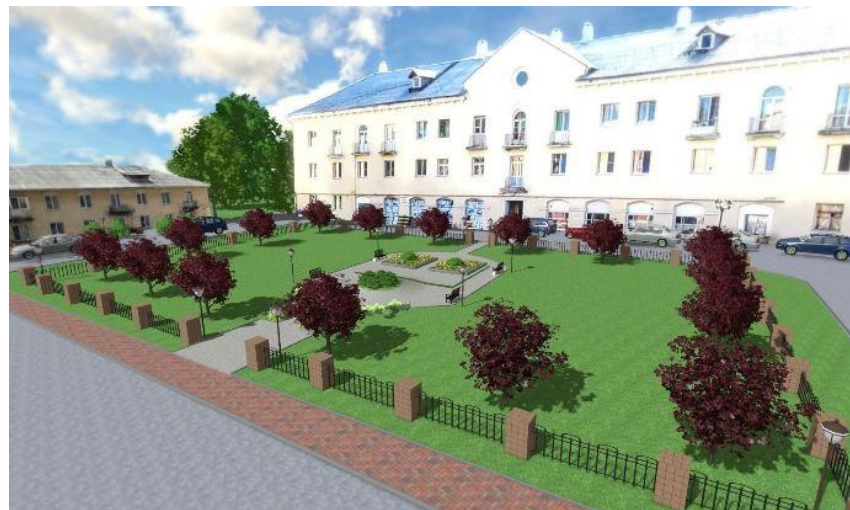
Сквер по ул. М.Горького