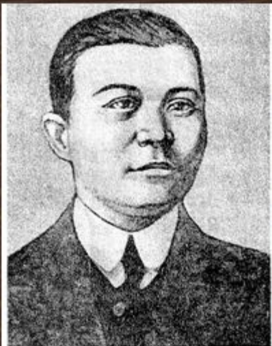
СУЛТАНМАХМУТ ТОРАЙГЫРОВ (1893-1920)