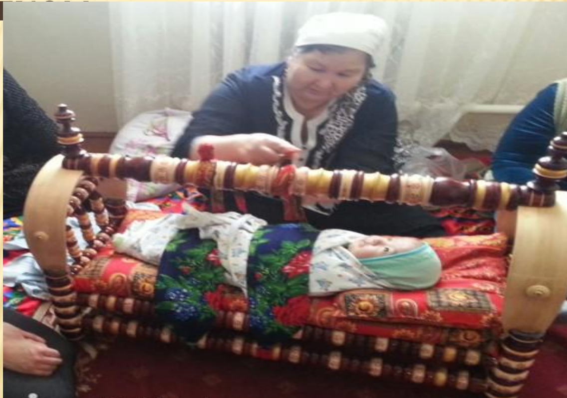
казахская колыбель – бесик

Для казахов рождение ребенка всегда было значительным и радостным событием