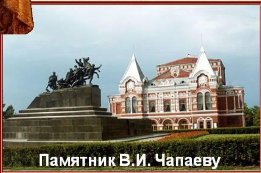
Памятник В.И. Чапаеву