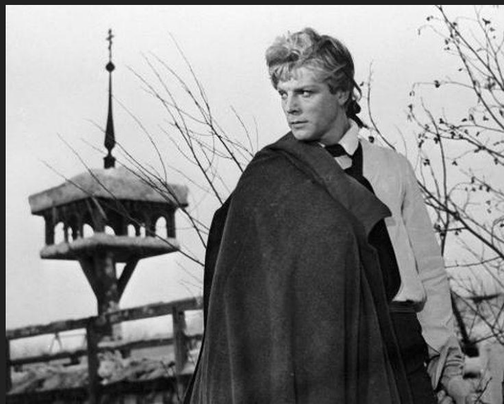
Олег Стриженов, актер, сыгравший Петра Гринева в фильме 1958 года.