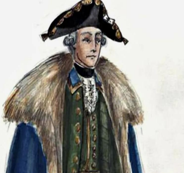
Петр Гринев, образ из романа А.С. Пушкина