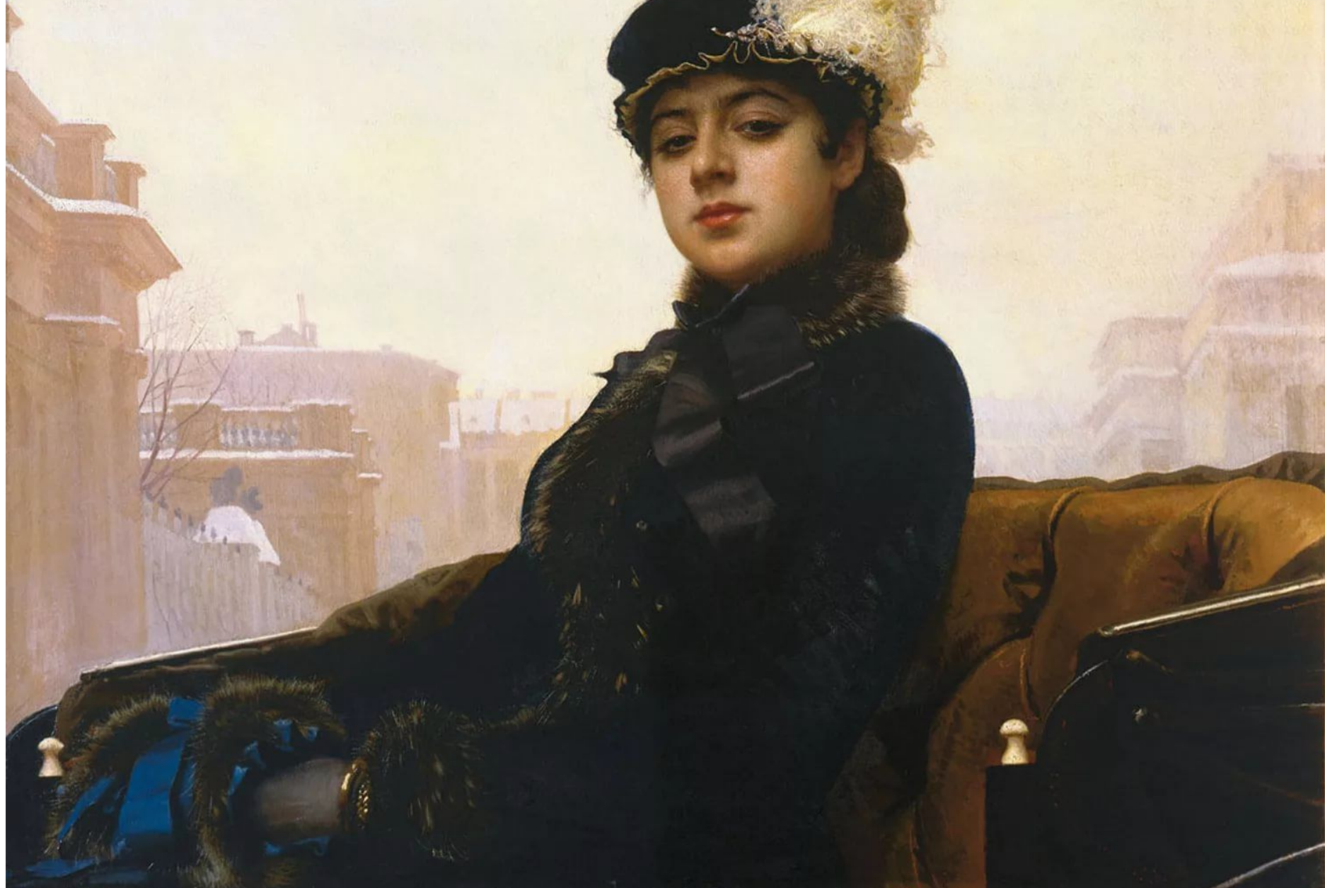
Иван Крамской Неизвестная. 1883