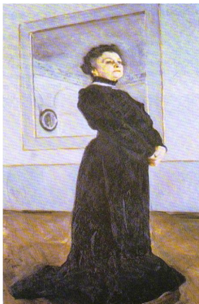
В.Серов. Портрет М.Н.Ермоловой