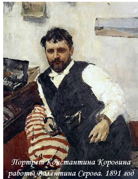
Портрет Константина Коровина работы Валентина Серова. 1891 год

Константин Алексеевич Коровин (1861-1939) — выдающийся русский живописец, театральный художник и педагог.