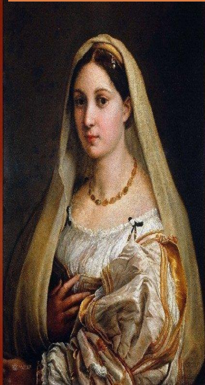
Донна Велата (Дама с вуалью) 1514 г.