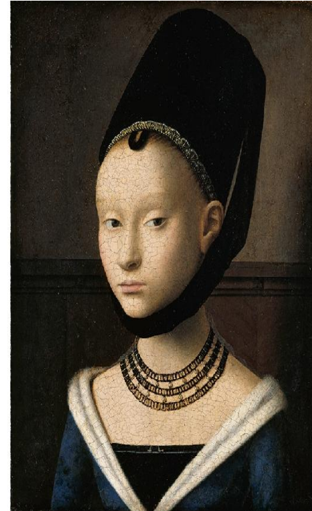
Петрус Кристус. Портрет молодой девушки, ок. 1490.