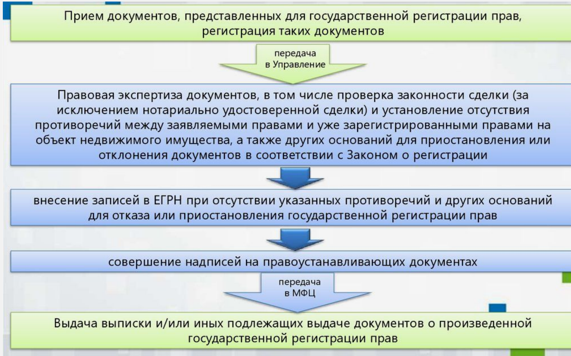
Рис.2.1.порядок ведения государственной регистрации прав