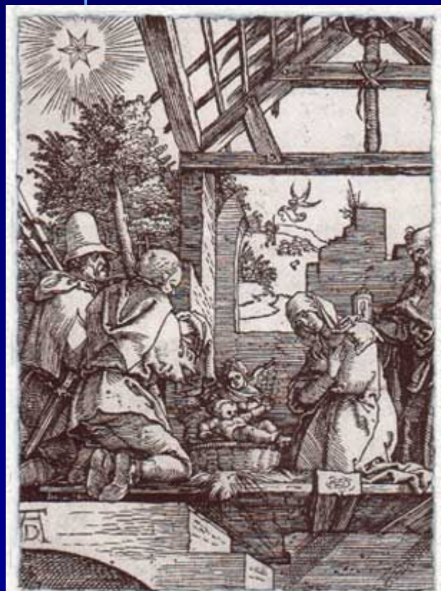
Ок. 1509-1511. Поклонение пастухов. Альбрехт Дюрер. Гравюра на дереве. 127x98. Эрмитаж.