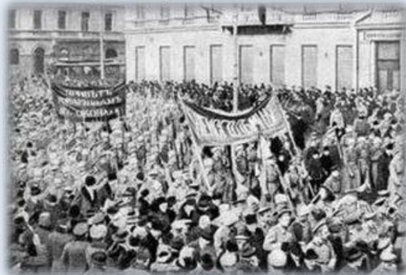
Демонстрация на Невском проспекте