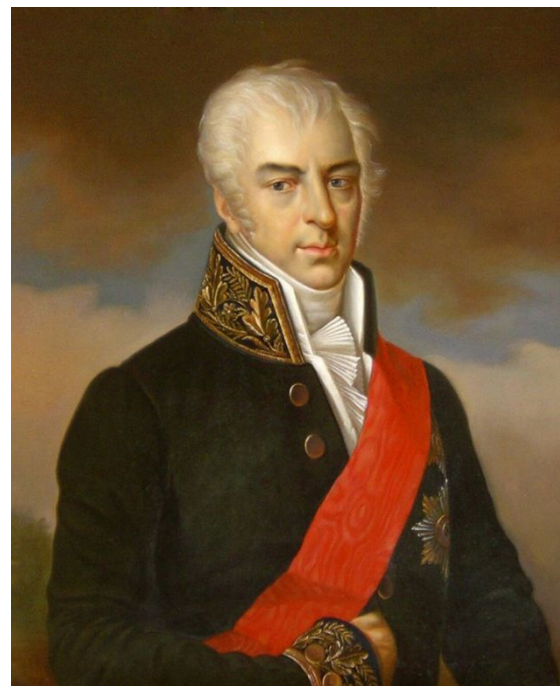
князь Ф. И. Лобковиц