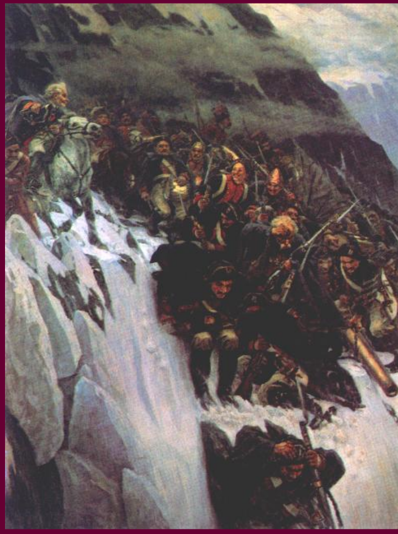
Переход Суворова через Альпы

Союзники России - Австрия и Англия, обеспокоенные успехами Суворова, потребовали чтобы Павел послал его в Швейцарию на помощь корпусу Римского-Корсакова.