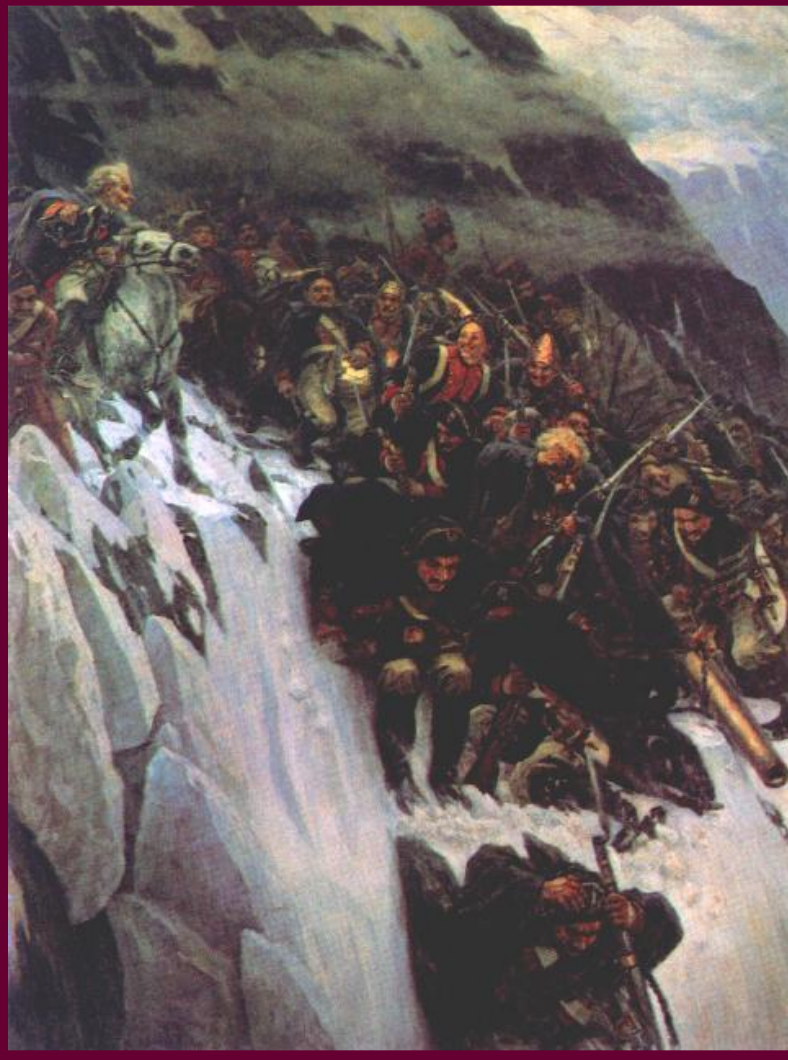
Переход Суворова через Альпы

Союзники России - Австрия и Англия, обеспокоенные успехами Суворова, потребовали чтобы Павел послал его в Швейцарию на помощь корпусу Римского-Корсакова.