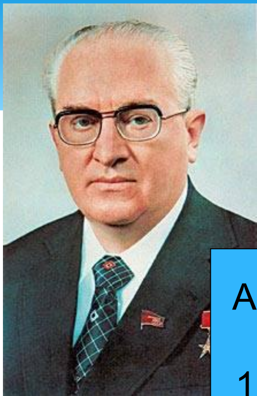
Андропов Ю. В. 1982-1984 гг.