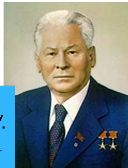
Черненко К.У. 1984-1985 гг.