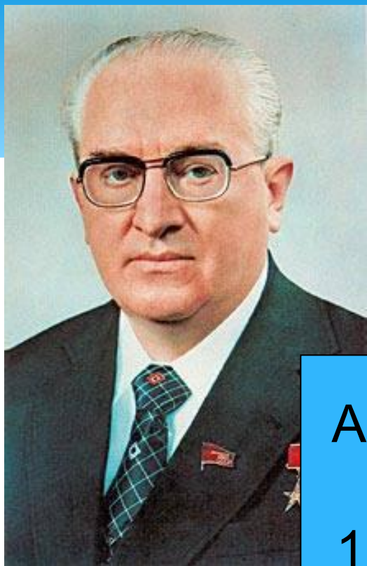
Андропов Ю. В. 1982-1984 гг.