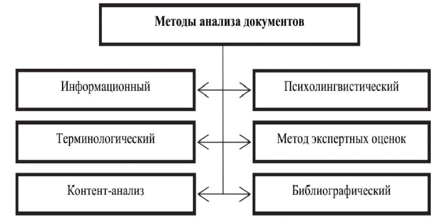
Рис. 3.2. Методы анализа документов