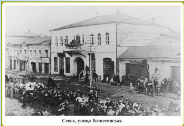
Севск, улица Вознесенская.