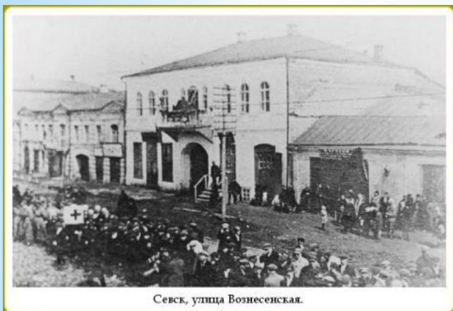
Севск, улица Вознесенская.