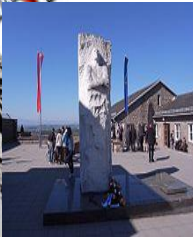
Памятник генералу Д. М. Карбышеву на территории бывшего концентрационного лагеря Маутхаузен, Австрия.

Три с половиной года провел Д. М. Карбышев в лагерях смерти. Его склоняли перейти на сторону фашистов как опытного военного инженера, но гитлеровцам не удалось сломить волю советского генерала. Несмотря на преклонный возраст стойко переносил все ужасы гитлеровских застенков, до последнего дыхания оставался пламенным патриотом, верным сыном Родины.