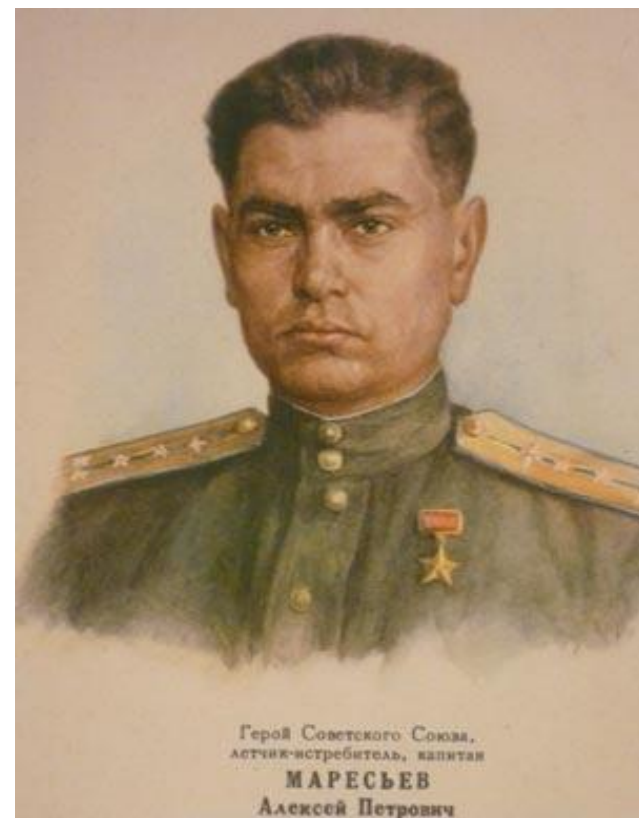
Герой Советского Союза, лётчик-истребитель, капитан МАРЕСЬЕВ Алексей Петрович

Лётчик . Герой Советского Союза. О нём написана книга-«Повесть о настоящем человеке». Автор - писатель Борис Полевой.