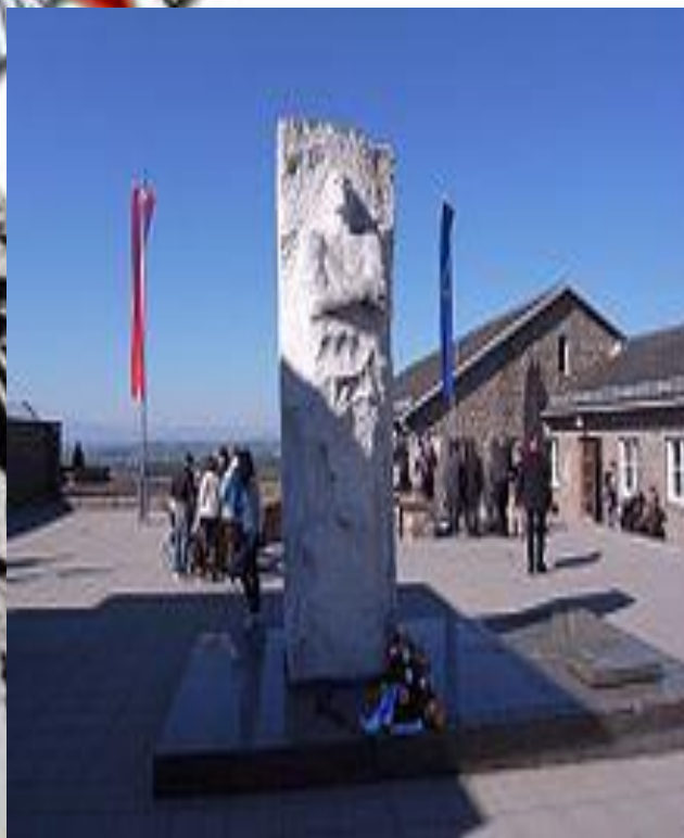
Памятник генералу Д. М. Карбышеву на территории бывшего концентрационного лагеря Маутхаузен, Австрия.

Три с половиной года провел Д. М. Карбышев в лагерях смерти. Его склоняли перейти на сторону фашистов как опытного военного инженера, но гитлеровцам не удалось сломить волю советского генерала. Несмотря на преклонный возраст стойко переносил все ужасы гитлеровских застенков, до последнего дыхания оставался пламенным патриотом, верным сыном Родины.