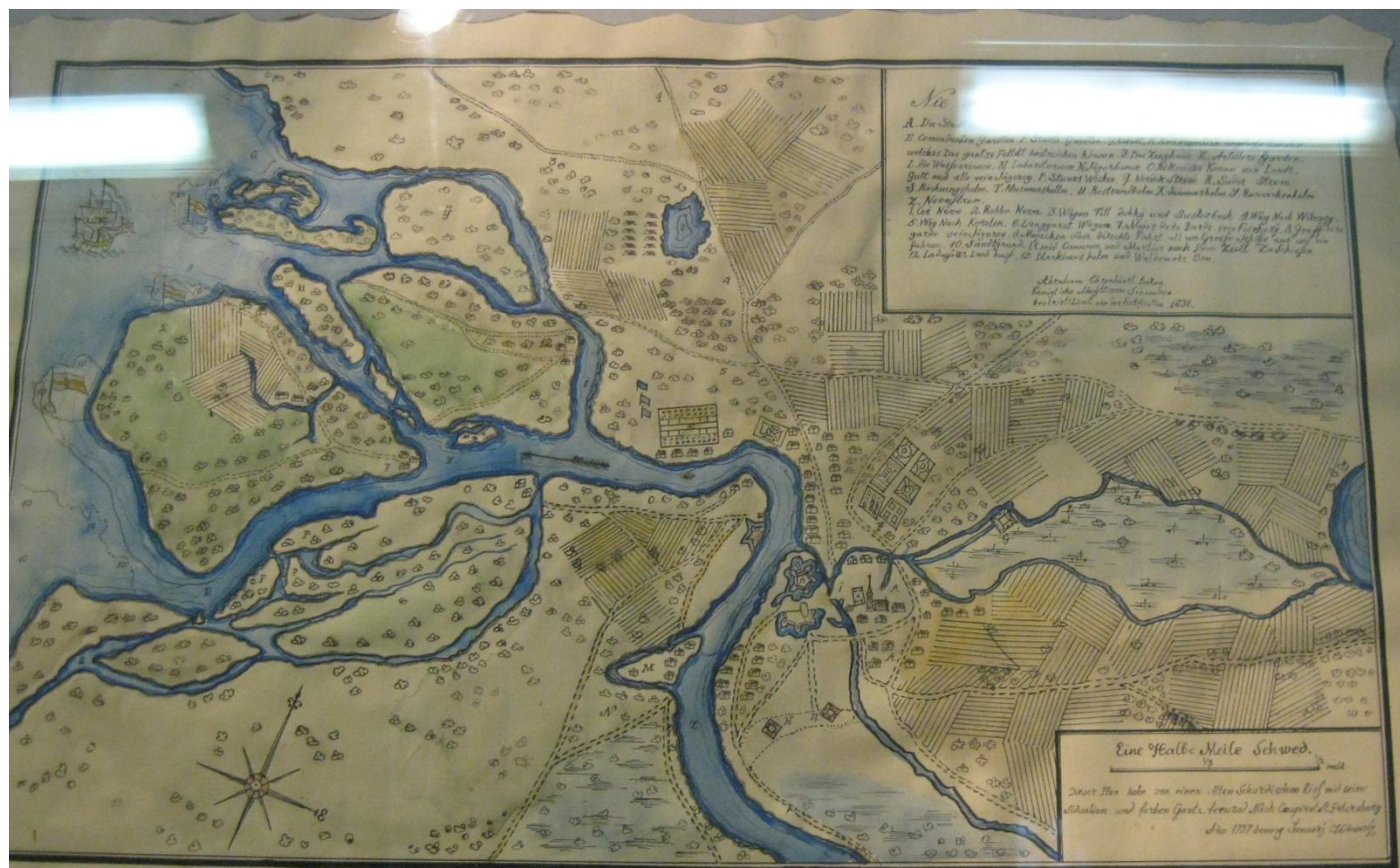
Карта устья Невы. 1698 г. Копия.