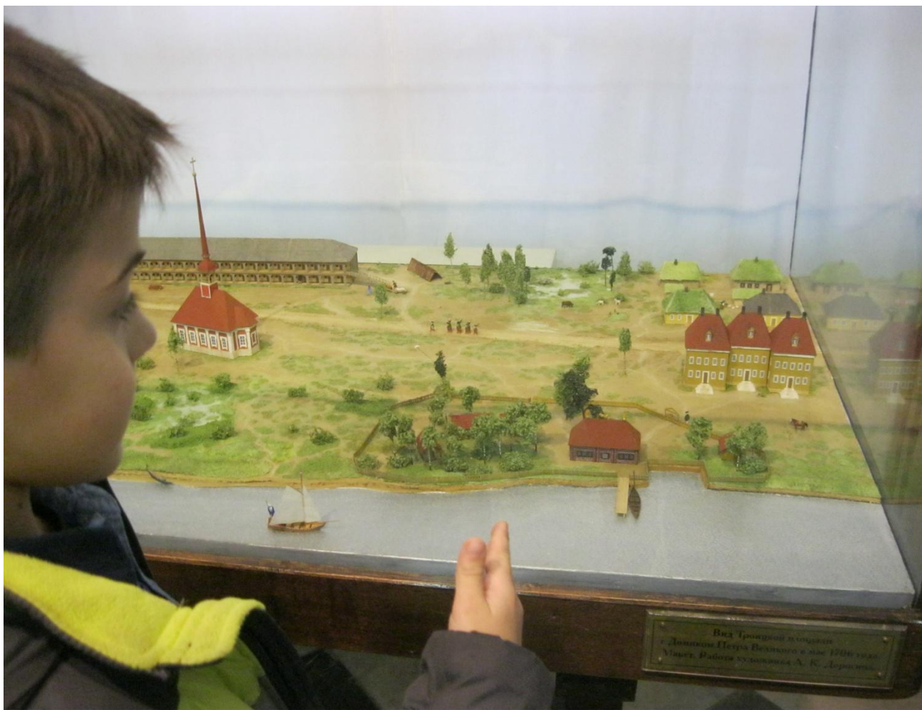
Вид Придвинья владения г. Доминико Петра Великого в мае 1706 года. Улицы. Район художника А. К. Дегерина.