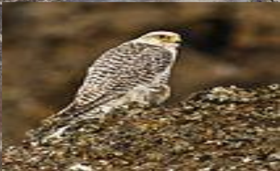
Кречет, национальный символ Исландии