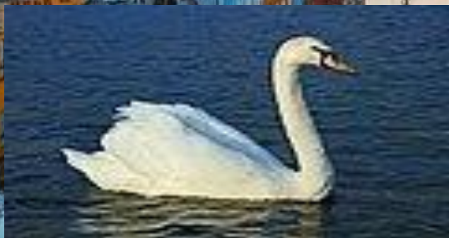
Лебедь-шипун, национальный символ Дании