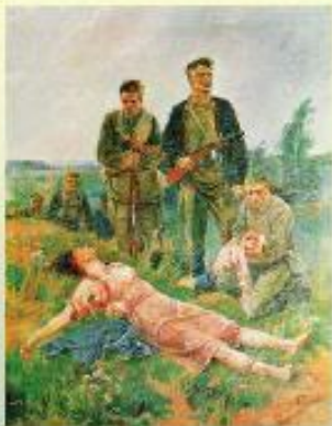
В. А. Серов Здесь прошел враг!