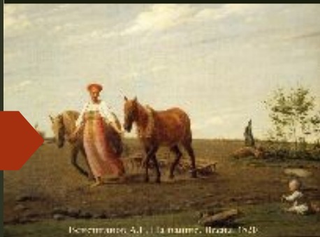
Венецианов А.Г. На жатве. 1848