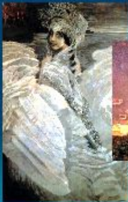
Царевна - лебедь