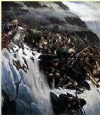
В. И. Суриков Переход Суворова через Альпы в 1799 году