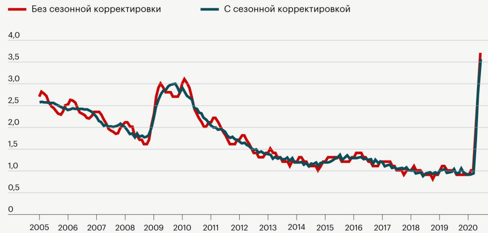
График 2. Месячная динамика уровня регистрируемой безработицы, 2005–2020 гг., %

Незначительные темпы роста экономики, недостаточный совокупный спрос, демографический кризис, низкая производительность труда, структурные диспропорции в экономике, низкий спрос на рынке занятости и другие различные экономические и социальные причины