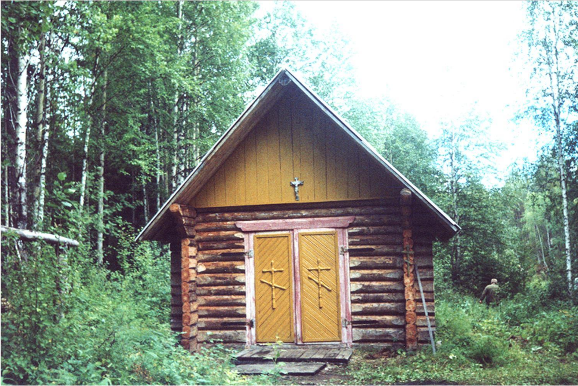
Вновь отстроенная Келья Оники Угодника д. Латьюга Удорского района Республики Коми. Фото 1998 г.