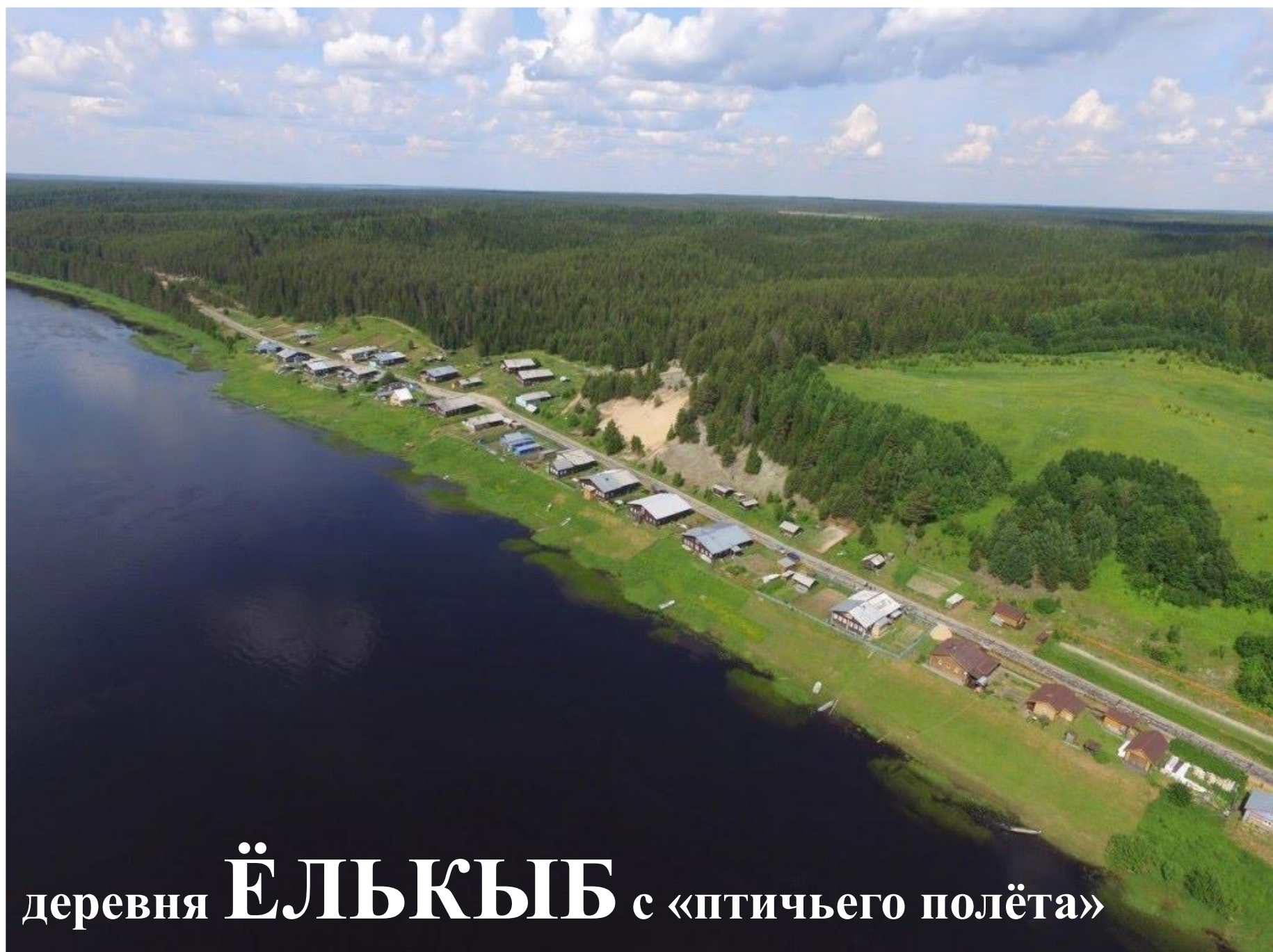
деревня ЁЛЪКЫБ с «птичьего полёта»