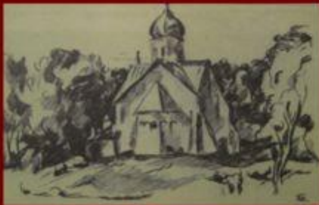
П.Л. Кончаловской. Зарисовка пейзажа

Вспомогательный рисунок. Зарисовка различных деталей, через зарисовку художник изучает детали будущей картины.