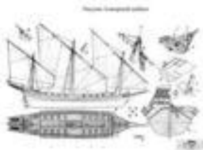
Чертеж строения корабля

Технический рисунок – это рисунок, который объясняет как устроен прибор.