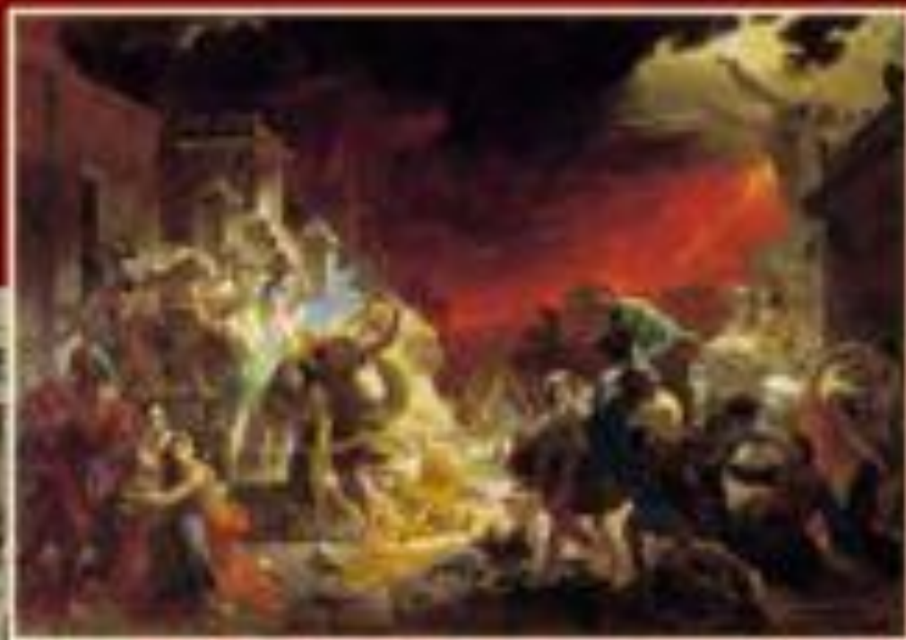
К. Брюллов «Последний день Помпеи»