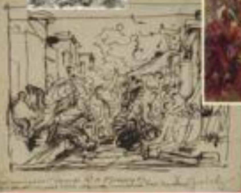
Один из первых набросков картины