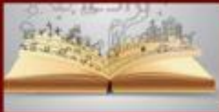
Рисунок - это изображение на плоскости, созданное с помощью графических средств.