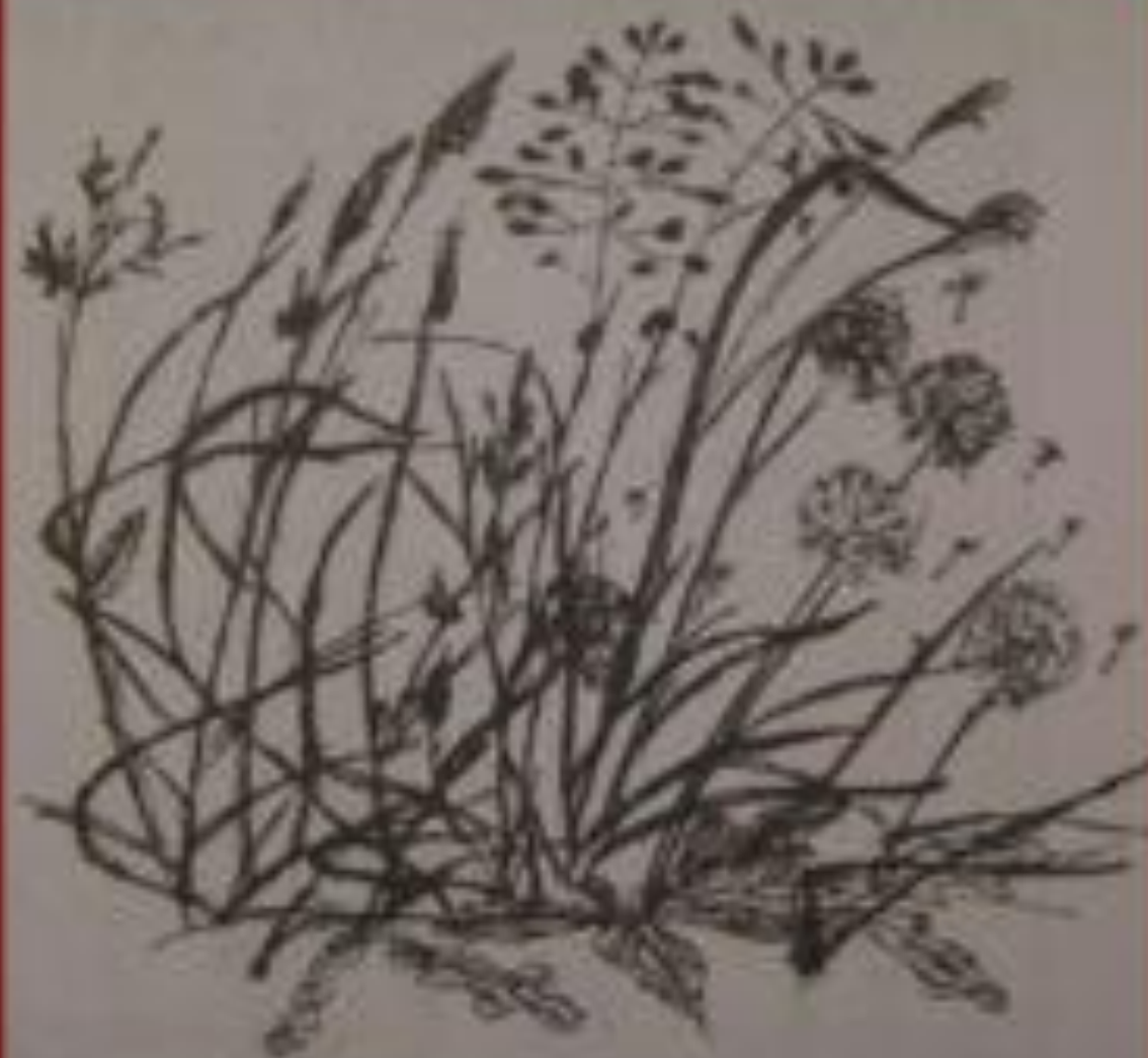
LIBETU N TRABA. Urtica pascua Tysse