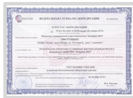
Аттестат аккредитации испытательной лаборатории