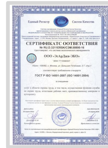
Сертификат соответствия ГОСТ ISO 14001-2007 (ISO 14001:2004)