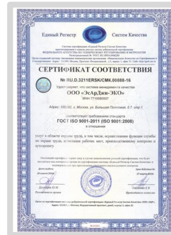
Сертификат соответствия ГОСТ ISO 9001-2011 (ISO 9001:2008)