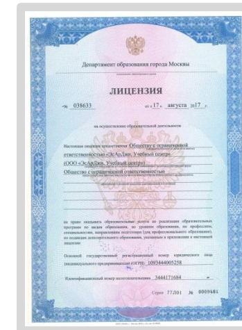
Лицензия на осуществление образовательной деятельности