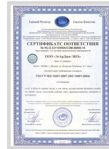
Сертификат соответствия ГОСТ ISO 14001-2007 (ISO 14001:2004)