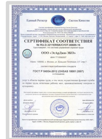
Сертификат соответствия ГОСТ Р 54934-2012 (OHSAS 18001:2007)