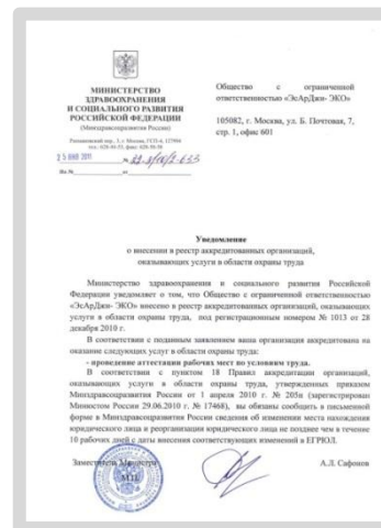
Уведомление о внесении в реестр аккредитованных организаций, оказывающих услуги в области охраны труда