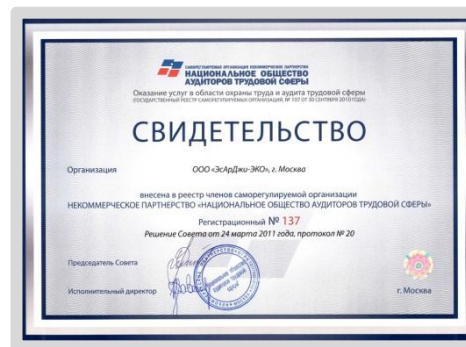
Свидетельство о внесении в реестр членов СРО НП "Национальное общество аудиторов трудовой сферы"