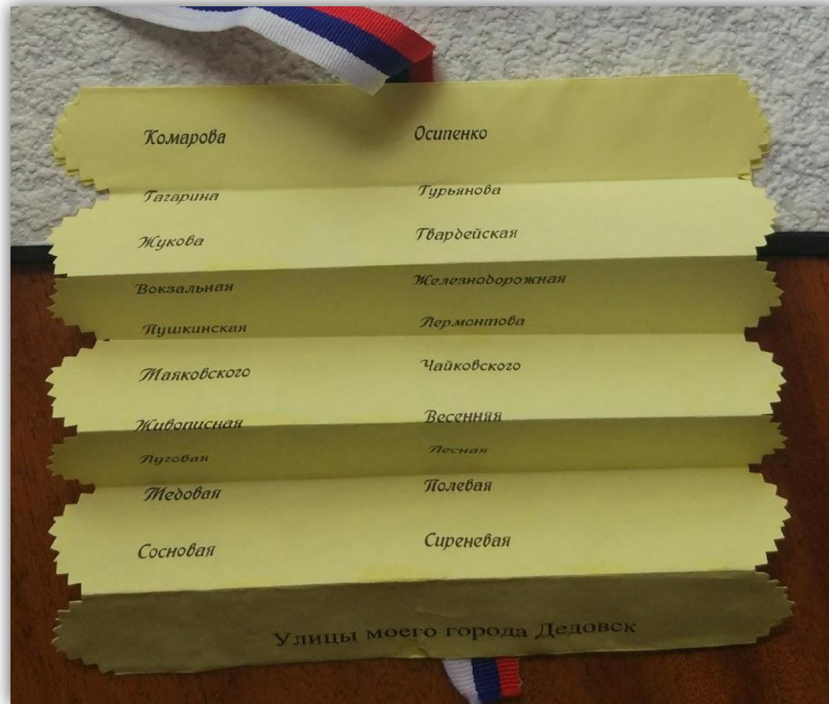
Фотоальбом «Достопримечательности», архитектурные, скульптурные, и исторические места. Улицы, на которых были в течении года