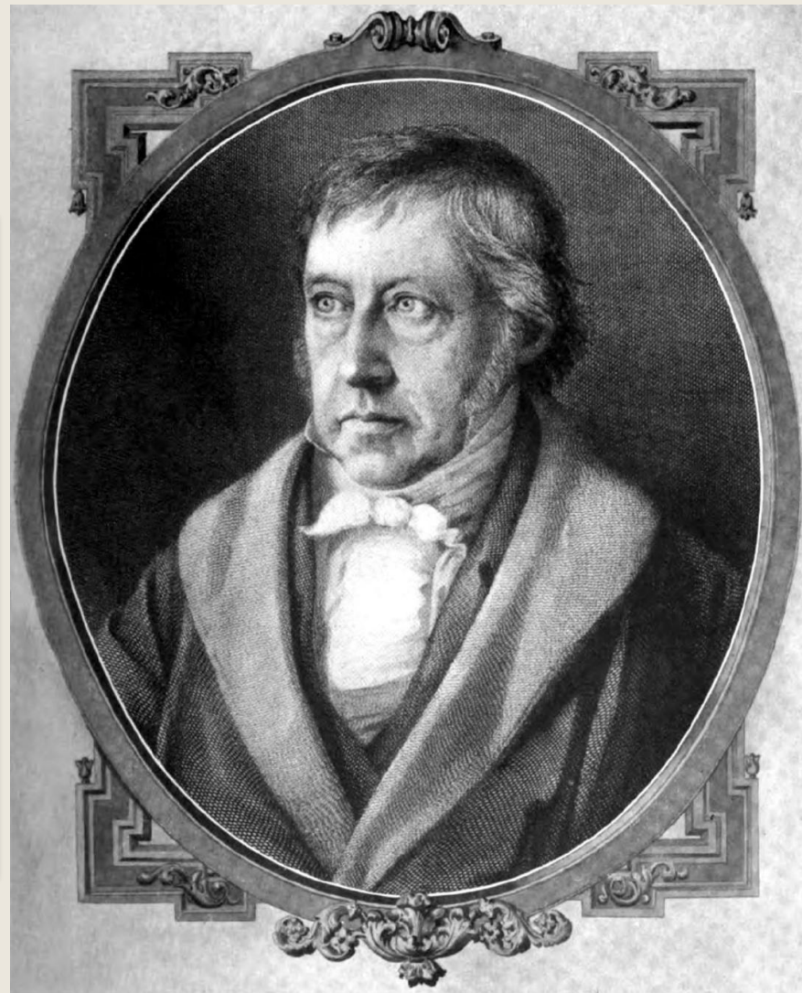
Гегель Георг Вильгельм Фридрих (27.08.1770–14.11.1831)

«Право и мораль отличаются друг от друга. Нечто вполне позволительное с точки зрения права быть чем-то таким, что моралью запрещается. Право, например, мне разрешает распоряжаться своим имуществом, совершенно не определяя пределов этого распоряжения, и только мораль содержит определения, которые его ограничивают»