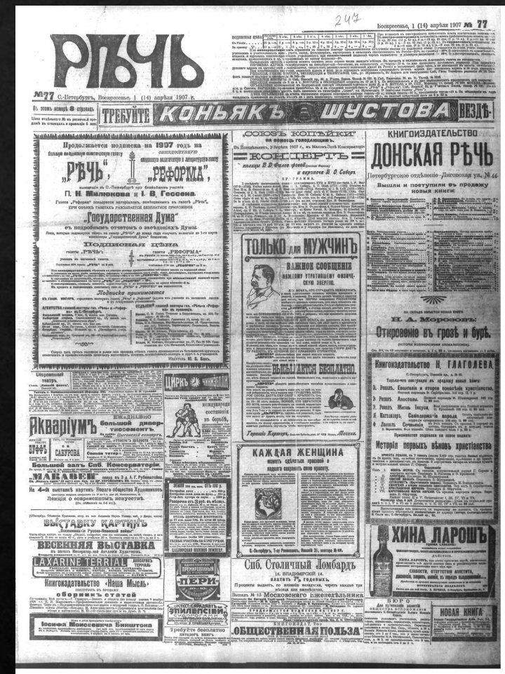
Апрель 1907г., выпуск 77