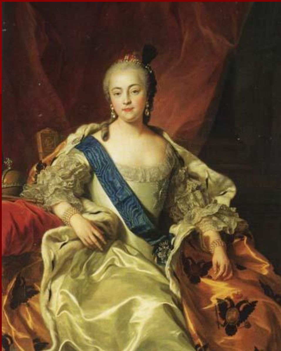
Русская Императрица Елизавета Петровна (1709-1761)