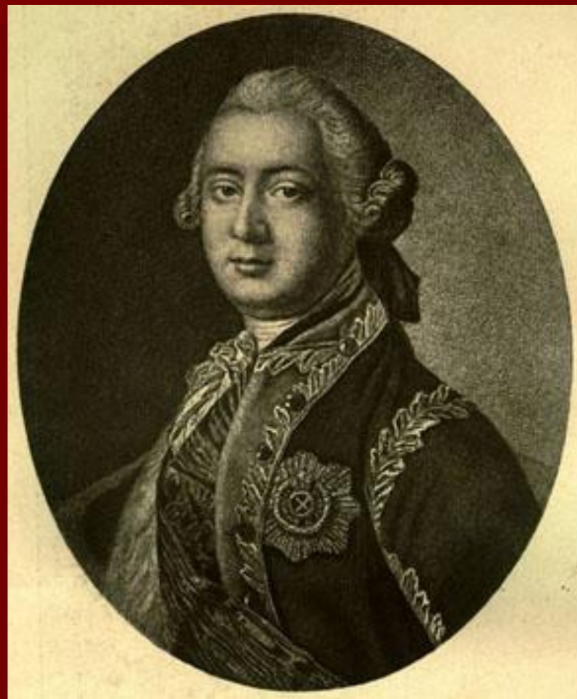
Алексей Разумовский (1709 – 1771)

Так и не дождавшись жениха голубых кровей, 24 - летняя красавица отдала сердце, придворному певчему Алексею Разумовскому. Став императрицей, Елизавета возвела своего морганистического супруга в графское достоинство, сделала фельдмаршалом и кавалером всех орденов. Но Разумовский сознательно устранился от участия в государственной жизни.