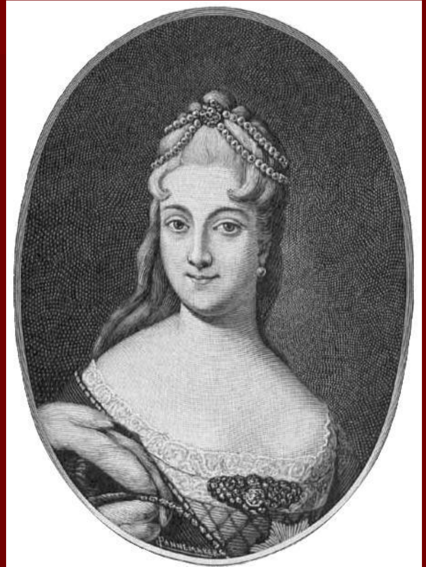
Екатери́на Алексеевна Долгору́кова

После кончины Петра II, обручённого с Екатериной Долгоруковой, от оспы в январе 1730 г. Елизавета, несмотря на завещание Екатерины I, фактически не рассматривалась как одна из претенденток на престол, который был передан её кузине Анне Иоанновне.