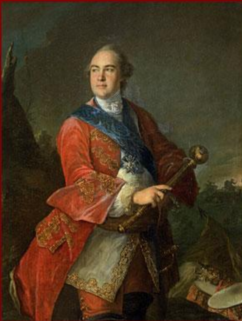
Кири́лл Григо́рьевич Разумо́вский (1728-1803)