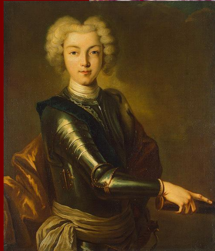
Пётр II Алексеевич

После брака родителей Елизавета Петровна носила титул цесаревны. Завещание Екатерины I 1727 г. предусматривало права Елизаветы и её потомства на престол после Петра II и Анны Петровны.