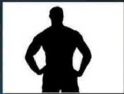
2-ОЙ СРЕДНИЙ ПЛАН