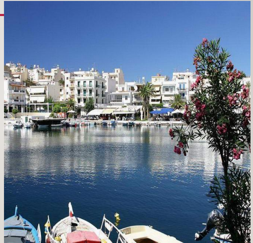
Греция. Остров Крит

Сегодня вы начнете свое воображаемое путешествие по Древней Греции, по земле Элады и познакомитесь с великим множеством ее достопримечательностей, Это путешествие продлится на несколько занятий и, наверное, будет для вас очень интересным.