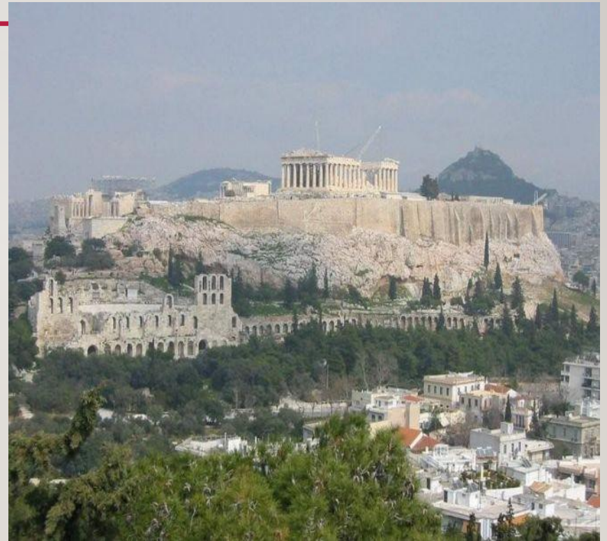
Древняя Греция. Афины