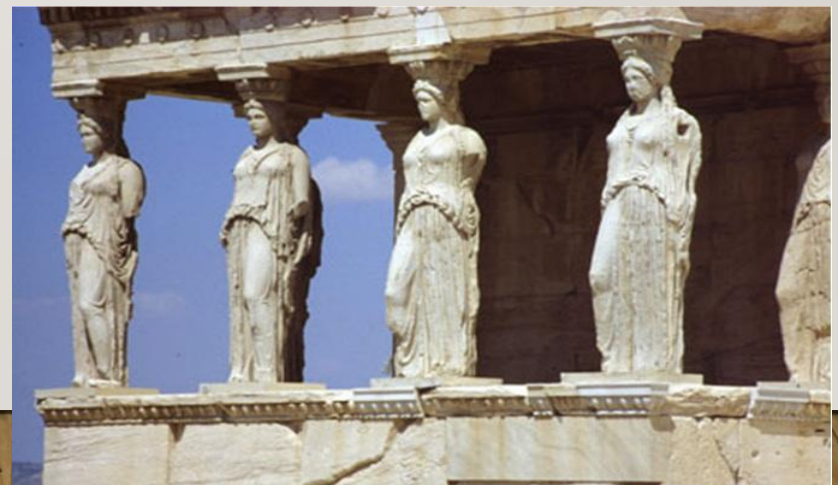
Кариатиды. Акрополь, Афины, Греция.