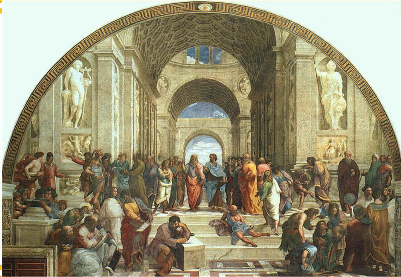
Рафаэль Санти. Афинская школа. (Ватиканский дворец)