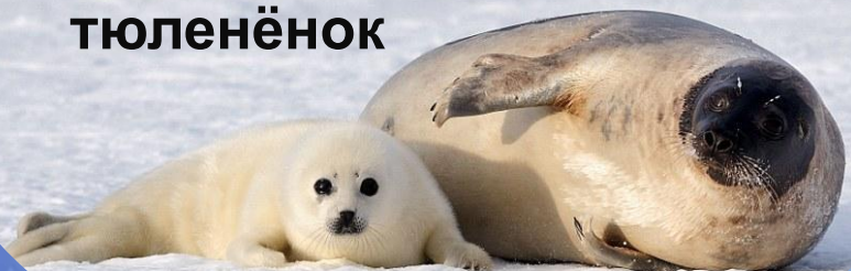
у тюленя – тюленёнок