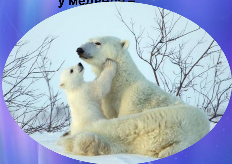
у медведя –