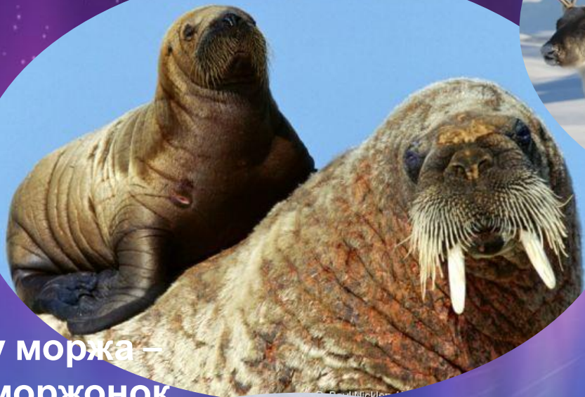
у моржа – моржонок