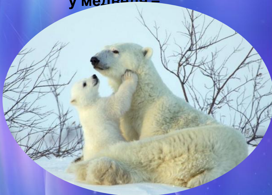
у медведя –