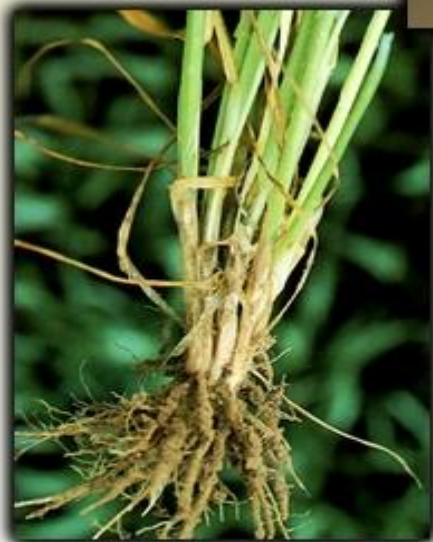
1. Корневая система мочковатая