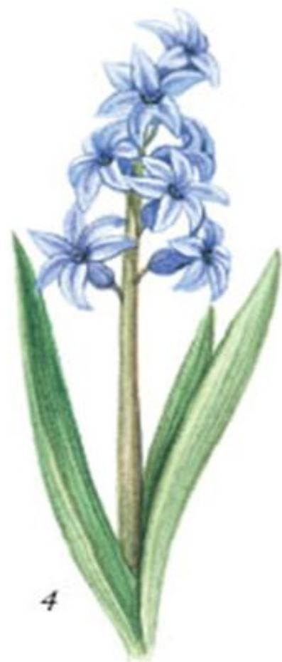
Рис. 109. Лилейные: 1 — лилия; 2 — кандык; 3 — тюльпан; 4 — гиацинт