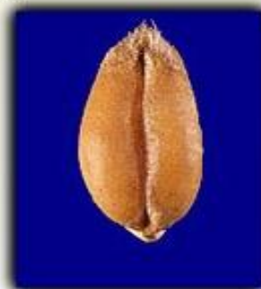
5. Плод — зерновка