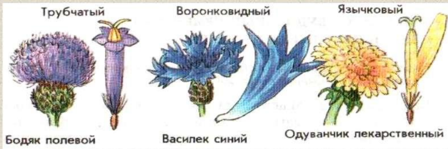
180. Цветки в соцветии корзинка

Цветки – язычковые (одуванчик), трубчатые (бодяк), воронковидные (василек)