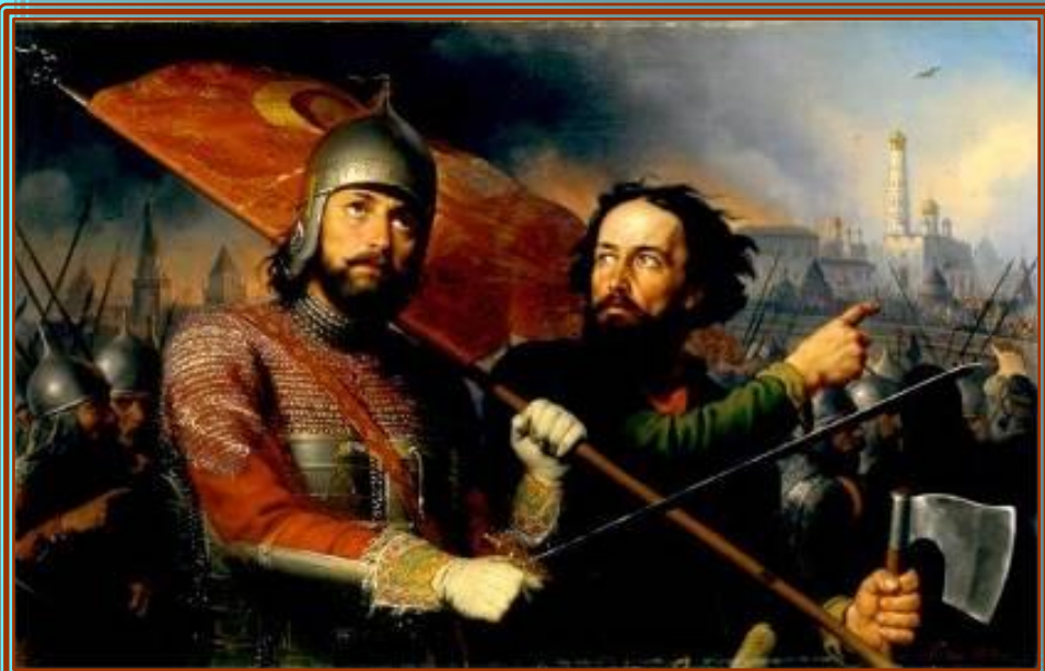
Минин и Пожарский. (художник Скотти М. И.)