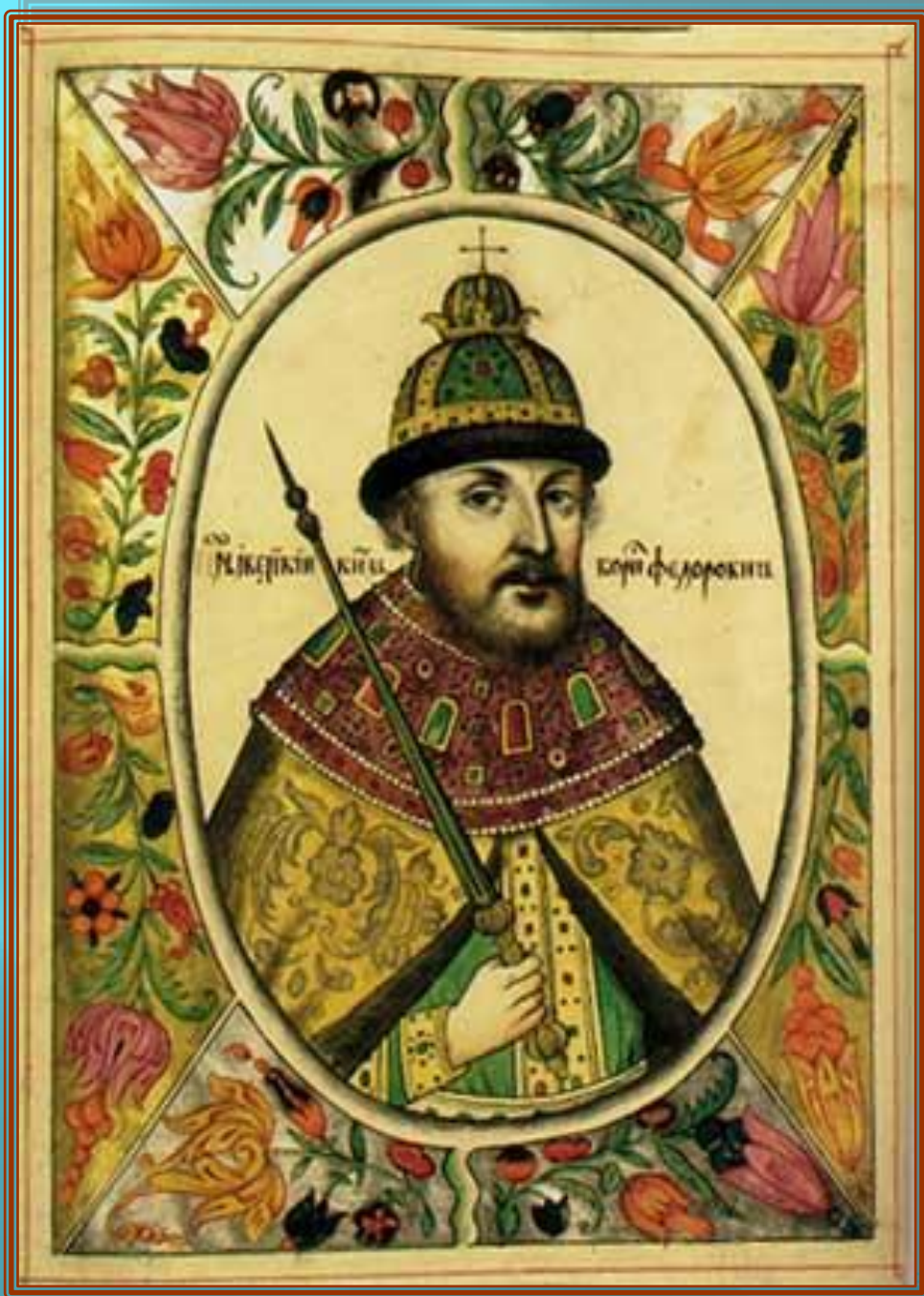
Царь Борис Фёдорович Годунов