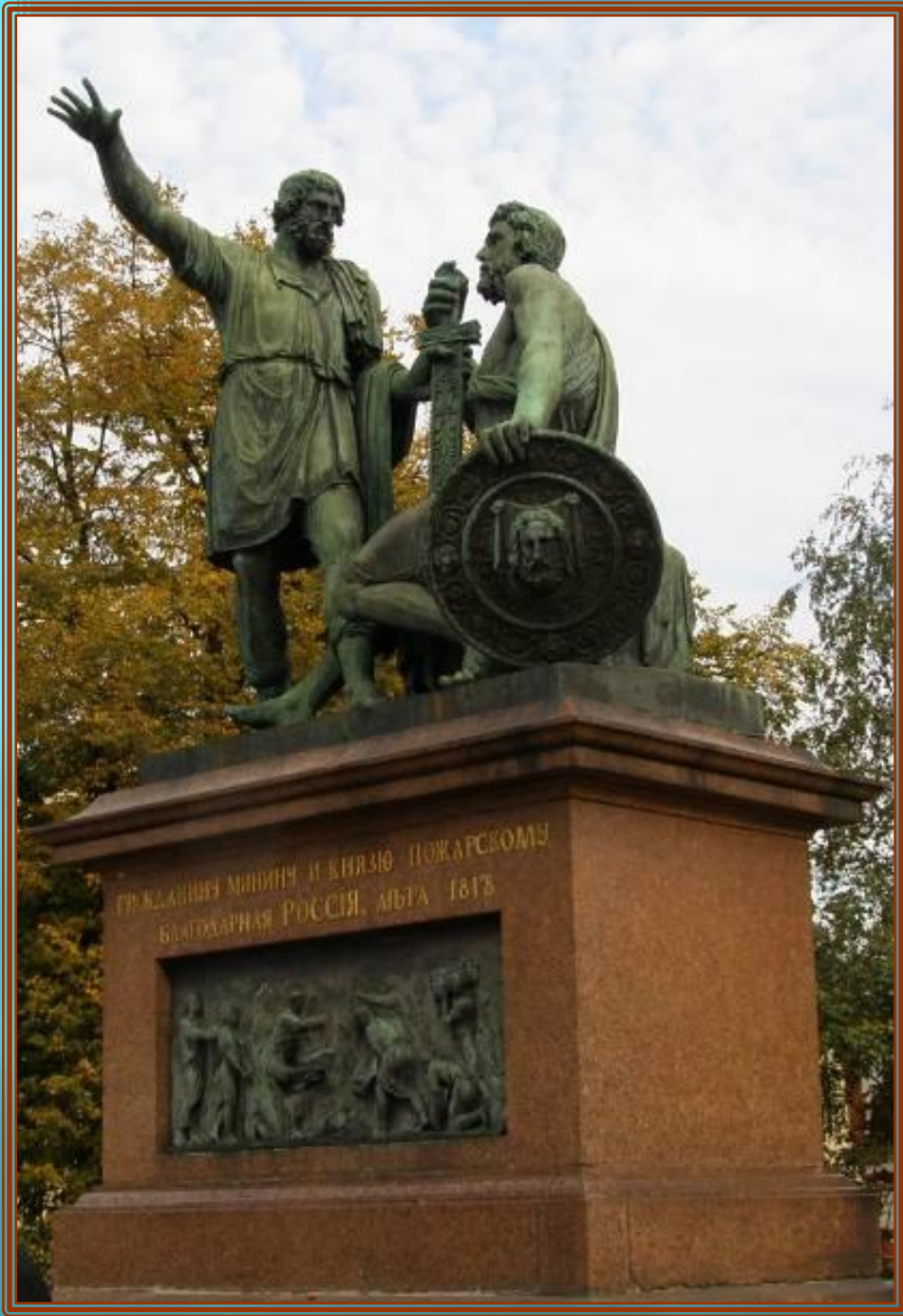
Памятник Минину и Пожарскому на Красной площади