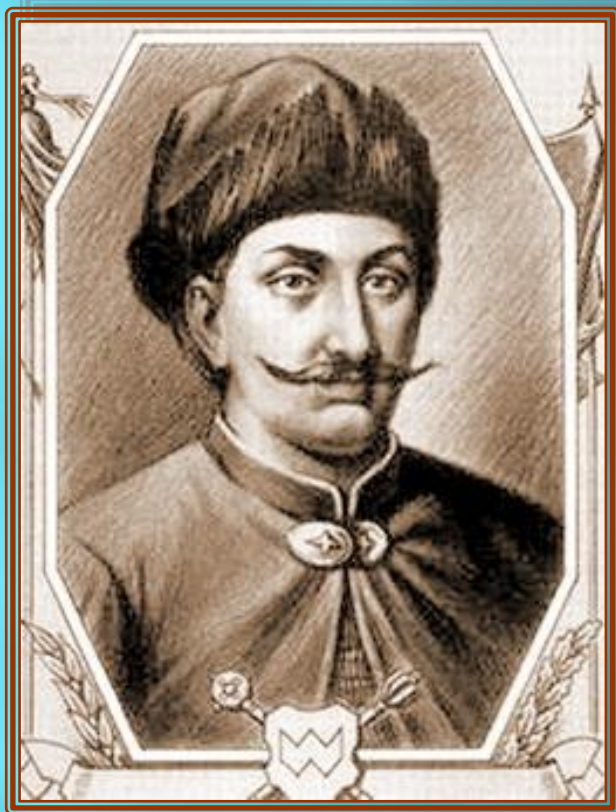
Дворянин Прокопий Петрович Ляпунов