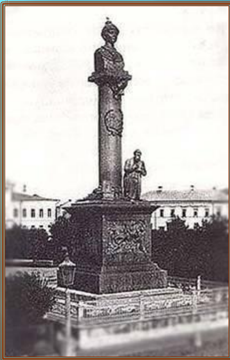
Дореволюционный памятник Михаилу Романову и Ивану Осиповичу Сусанину в Костроме.