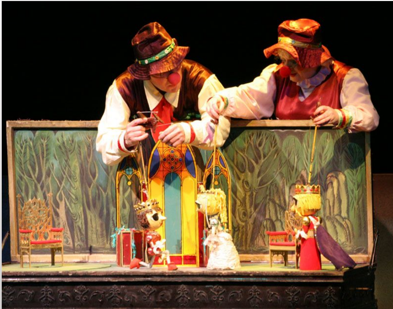
Театр С.В. Образцова (г. Москва)