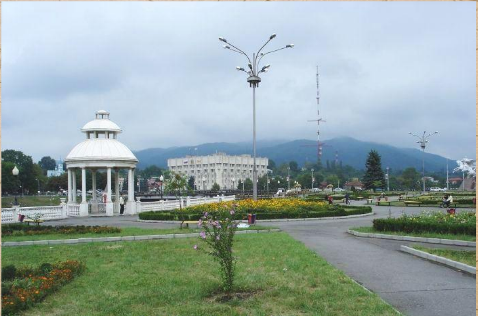
Æз цæрын Дзæуджихъæуы.