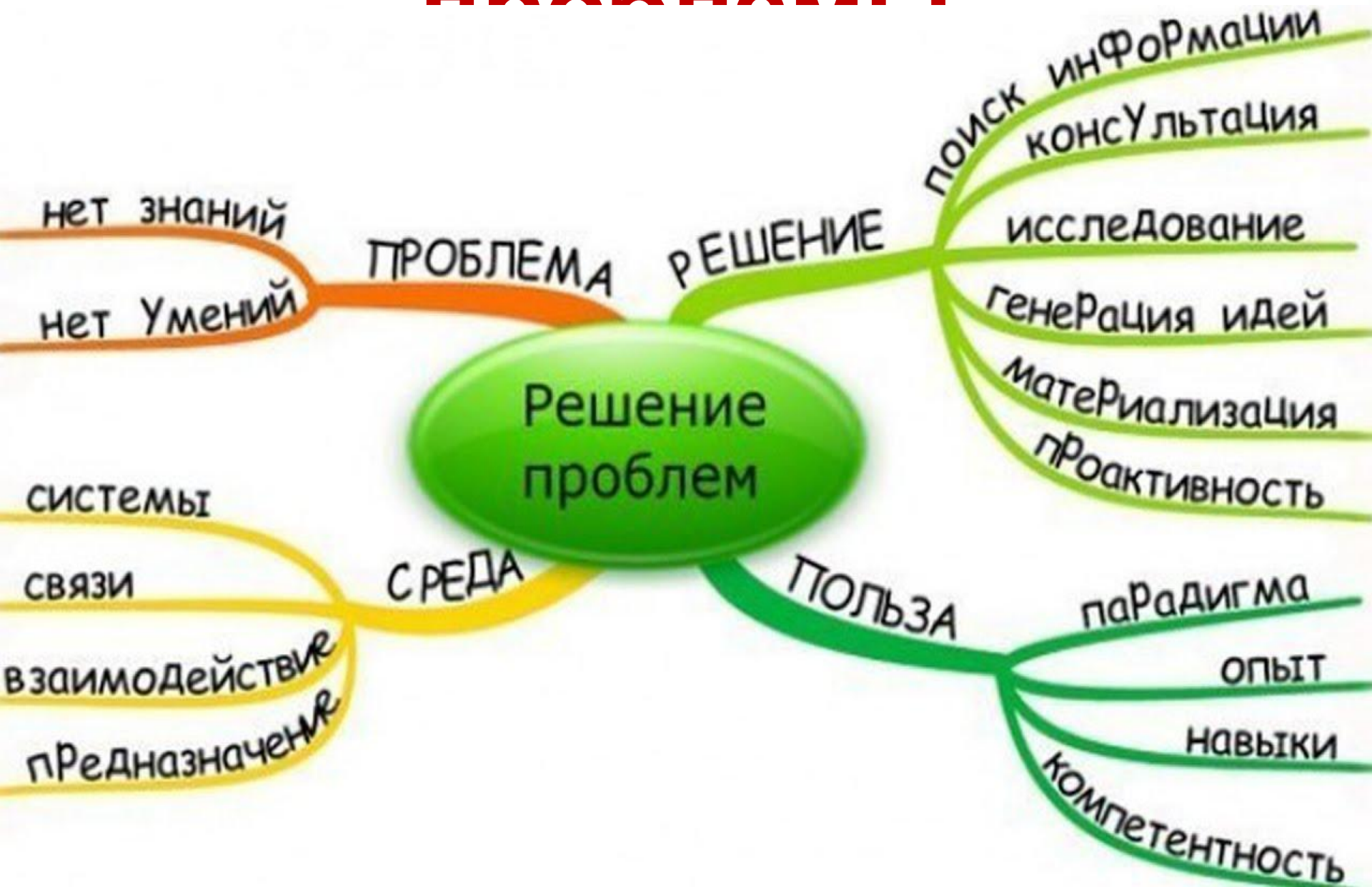
Схема решения проблемы