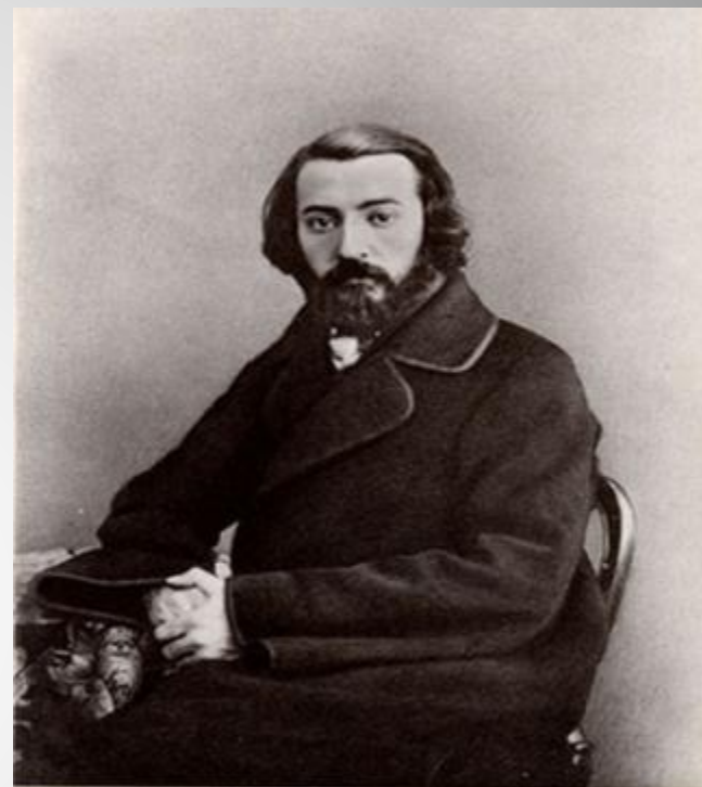
Павел Николаевич Рыбников

Открыл для нас бесценные сокровища духовной жизни народа, 1861-67г. Изданы 4 тома (165 былин) «Песни, собранные Рыбниковым».