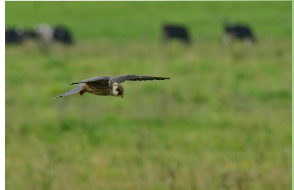
Молодой кобчик во время охоты на кузнечиков

Высматривает добычу с воздуха. Завидев цель, начинает энергично махать крыльями, создавая эффект зависания на одном месте