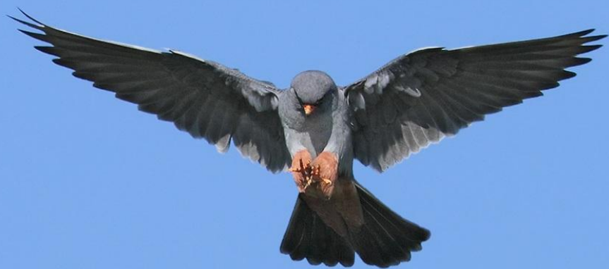
Кобчик самец на охоте

Затем камнем падает вниз и хватает добычу