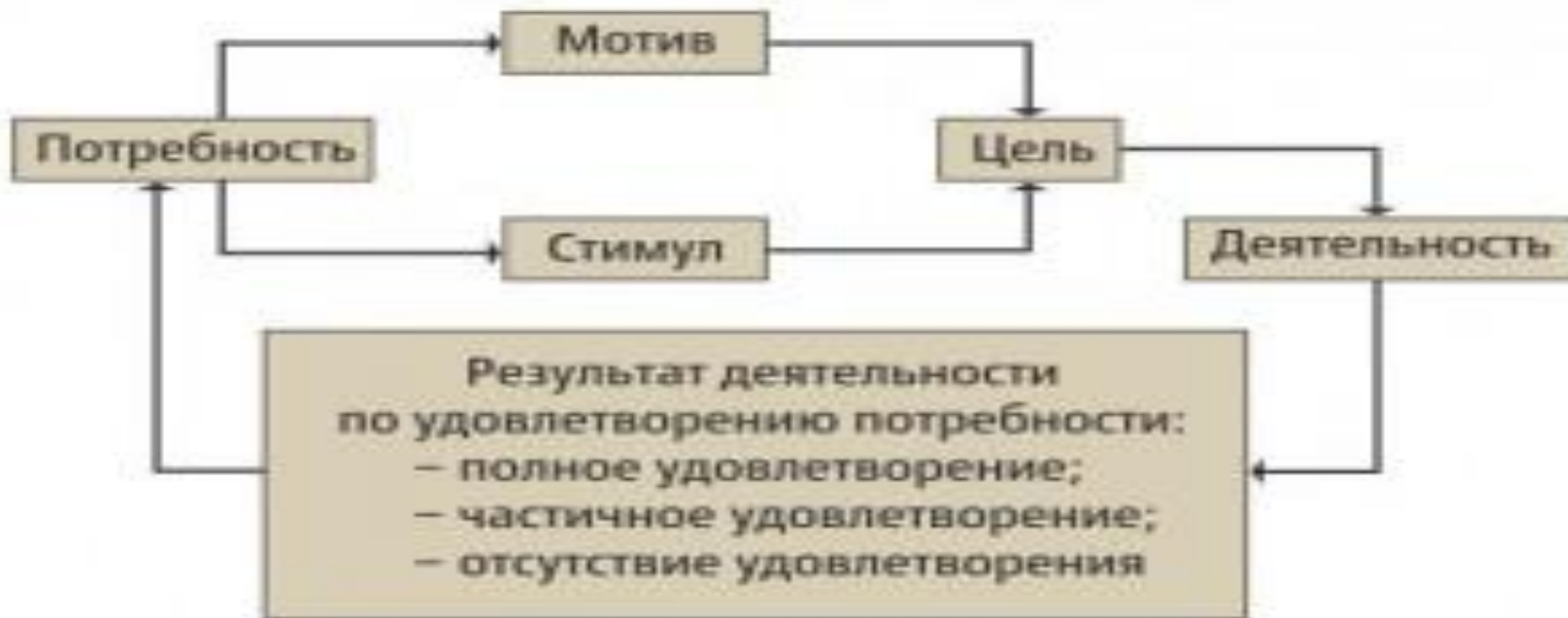
Рис. 2. Механизм мотивации